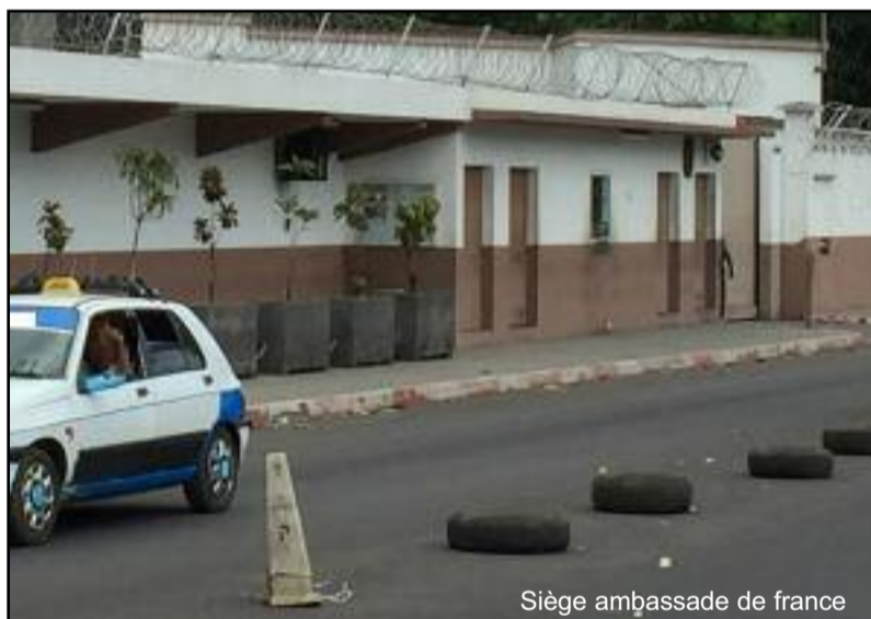
Siège ambassade de France

Interrogé la semaine dernière sur la fuite des handballeurs comoriens à La Réunion, la chancellerie française n'avait pas donné de réponse, peut-être trop occupé à la préparation de la fête nationale du 14 juillet. Et la représentation diplomatique française n'est pas allée par 4 chemins pour dénoncer cet acte incompréhensible et inadmissible. La réponse nous est