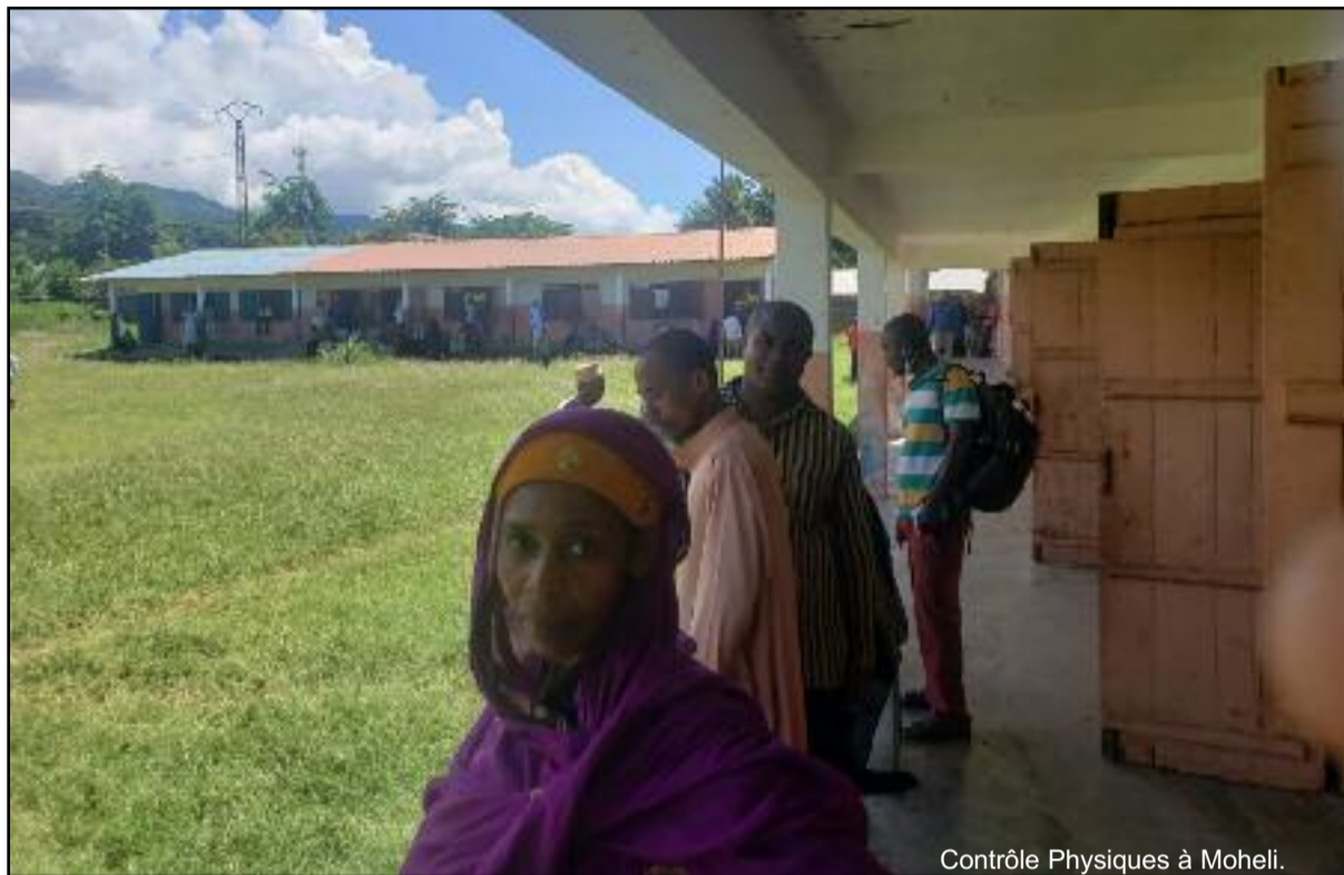
Contrôle Physiques à Moheli.

« Des enseignants ont fait le choix d'aller s'installer en France