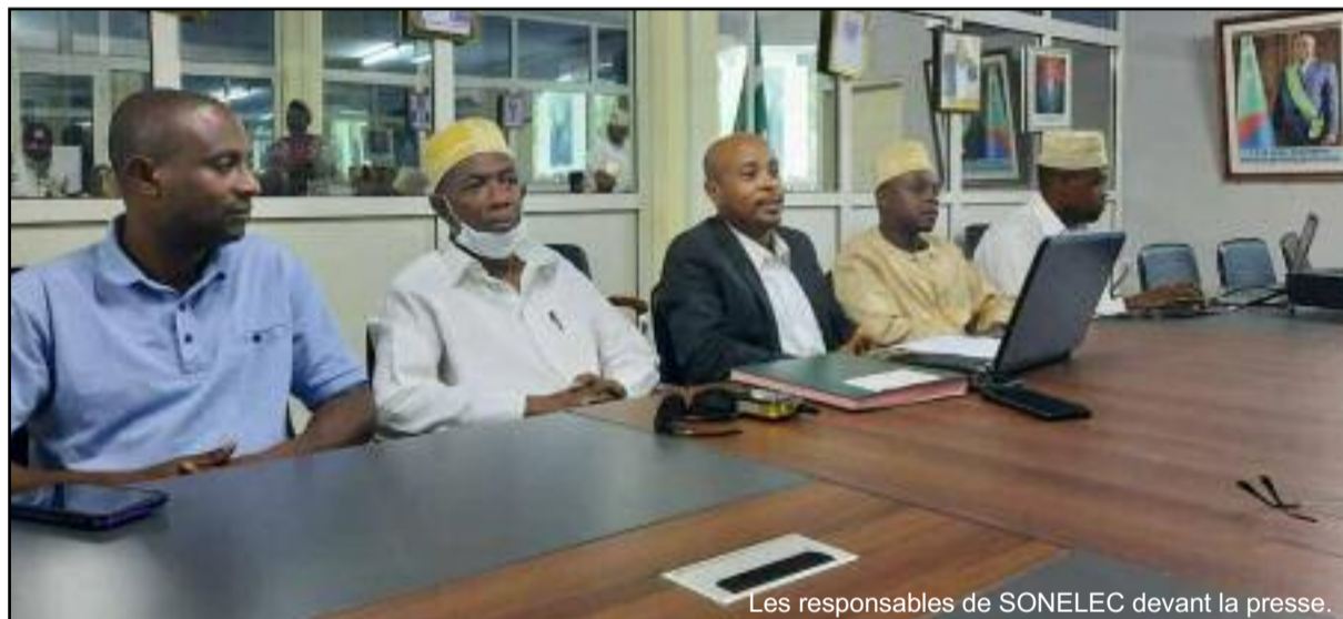
Les responsables de SONELEC devant la presse.

En outre, les conférenciers ont rebondi sur le cas du carburant. « Si la consommation est élevée passant de 70 000 litres habituelle à 79 000 litres par jour. C'est parce qu'on est obligé d'allumer tous les groupes électrogènes. Et cela est dû aux difficultés rencontrées par l'autre société partenaire Innonvent », explique-t-il, avant d'ajouter que « avant on synchronisait avec