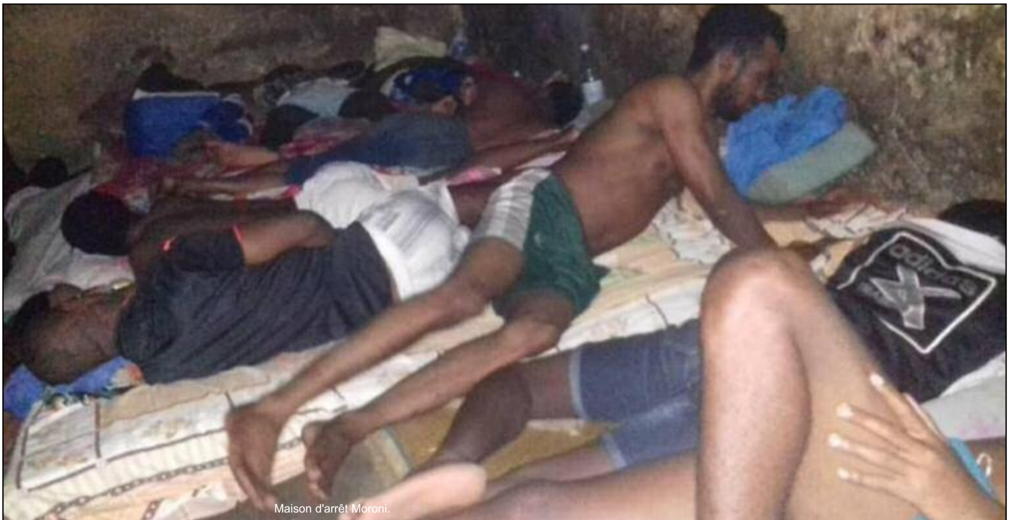
Maison d'arrêt Moroni.