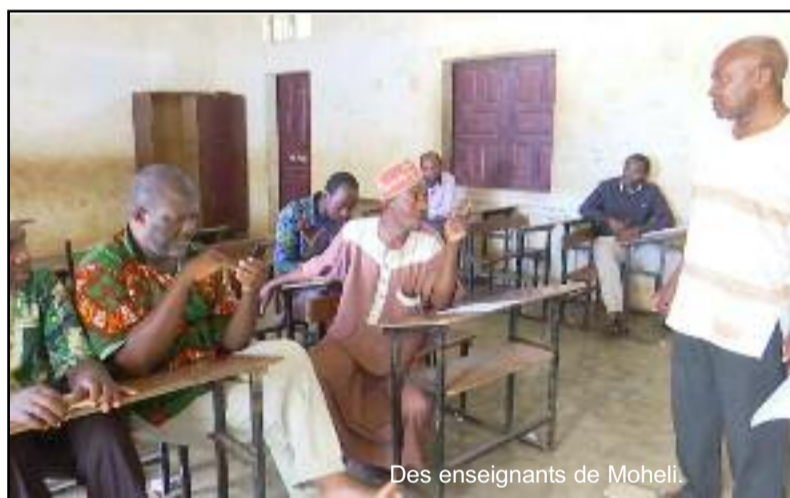
Des enseignants de Mohéli.

Pour rappel, sur une note n°22-01/IE/SG datant du 14 avril dernier, l'intersyndicale de l'éducation avait prévu d'entamer une grève illimitée dès le vendredi 6 mai suite à la décision inattendue du conseil de ministres du 13 avril dernier et qui a renvoyé les travaux de la commission technique conjointe ad-hoc. L'intersyndicale de l'éducation se dit