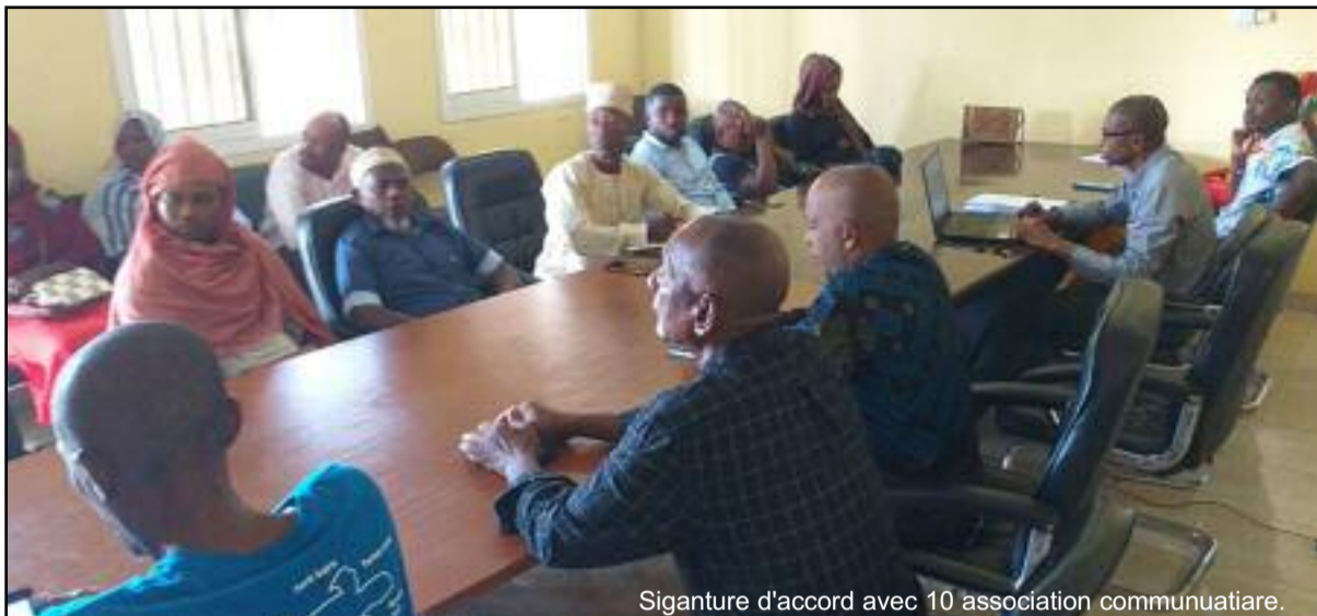
Signature d'accord avec 10 association communautiare.

« La subvention de ces projets est pour le Parc, une stratégie de promotion de sa politique de cogestion et de la gouvernance environne-