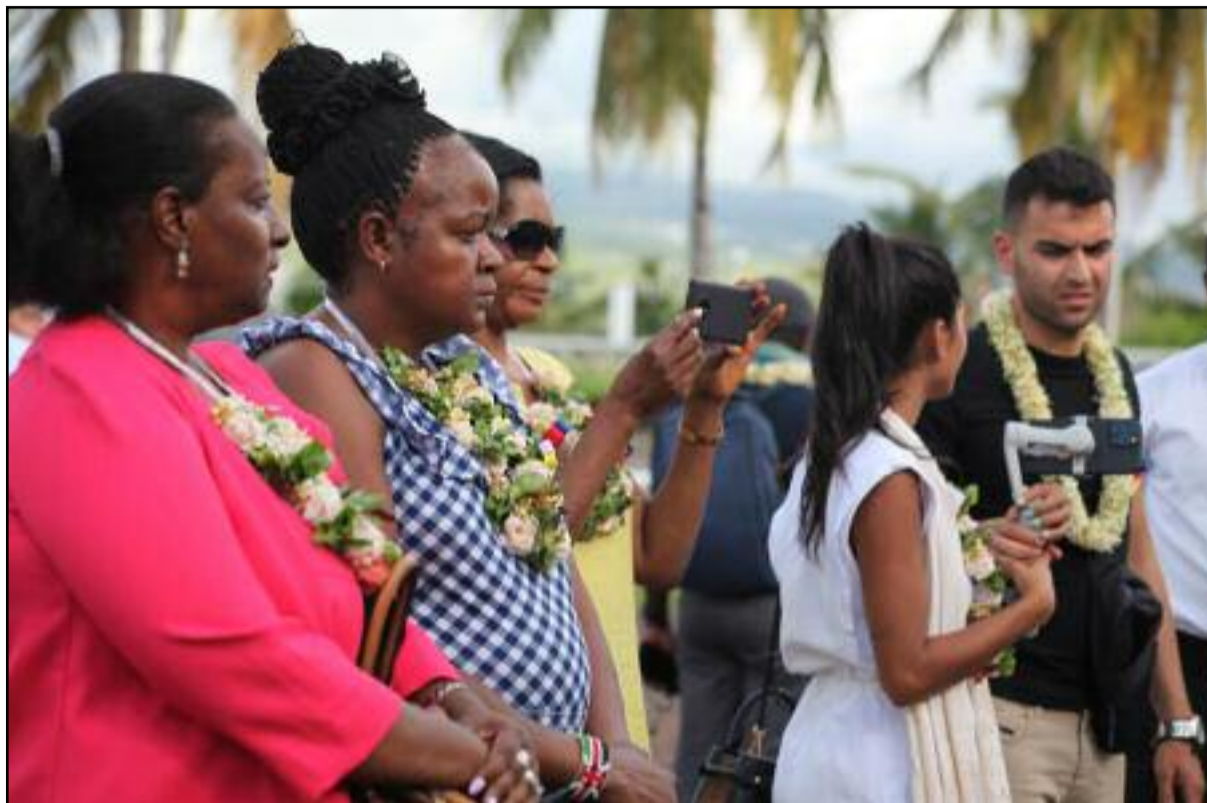
Arrivée des délégations à Moroni pour les 8e Assises du tourisme Responsable et Durable.

Pour le ministre Msaidié, « ces assises seront également l'occasion de lancer la Destination Comores, plébiscitée par les acteurs du secteur ; d'identifier les investissements prioritaires pour des "Victoires rapi-