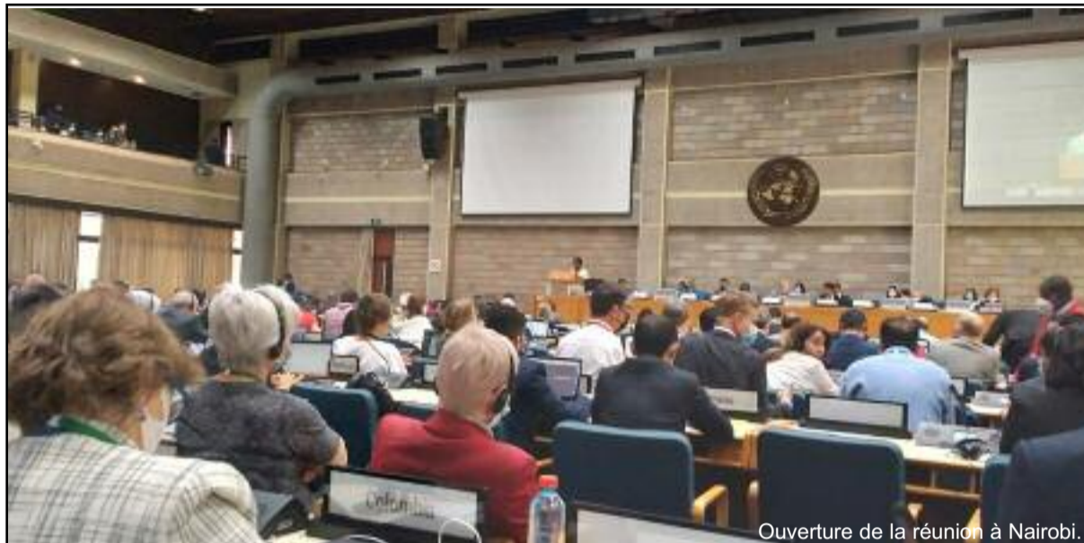
Ouverture de la réunion à Nairobi.

La quatrième réunion du Groupe de travail à composition non limitée sur le cadre mondial de la biodiversité pour l'après-2020, a débuté hier à Nairobi, au Kenya. Il faut savoir que près de deux ans se sont écoulés depuis l'expiration du Plan stratégique de la Convention sur la diversité biologique (CDB), qui comprend les 20 objectifs d'Aichi pour la biodiversité. Ces deux dernières années ont été parmi les plus tumultueuses pour la nature et les humains alors que le monde a été plongé dans une pandémie de santé sans précédent, la COVID-19.