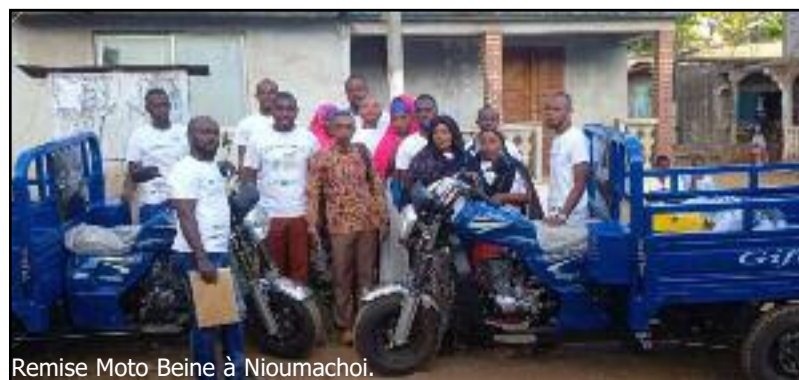
Remise Moto Beine à Nioumachoi.