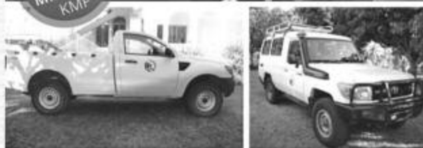
Les véhicules seront exposés Mer 10 août de 8h à 12h à Rive Gauche et le Jeudi 4 août à 8h30 au siège Peace Corps Comores, Mkazi