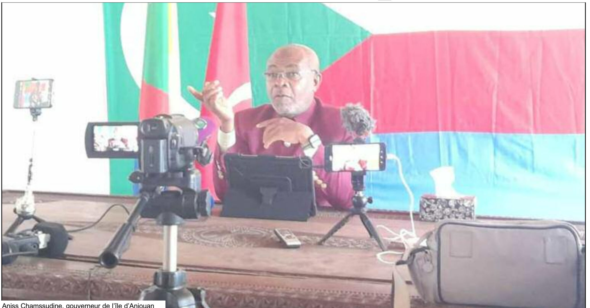
Aniss Chamssudine, gouverneur de l'île d'Anjouan