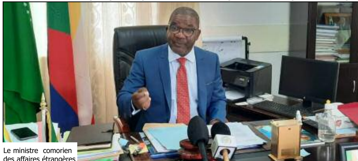
Le ministre comorien des affaires étrangères