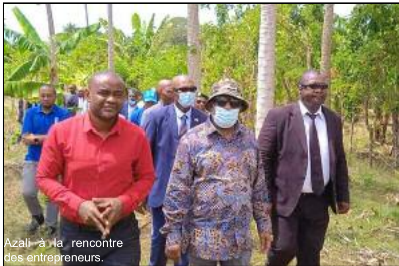
Azali à la rencontre des entrepreneurs.

Le chef de l'État Azali Assoumani s'est entretenu, lors de sa visite à Mohéli, samedi dernier, avec les jeunes lauréats du Concours plan d'affaires (CPA). Lequel concours vise à accompagner techniquement et financièrement les jeunes entrepreneurs comoriens avec des subventions directes dans les secteurs de l'agriculture, l'élevage, le tourisme et les secteurs connexes. Une occasion pour le chef de l'État d'effectuer quelques visites sur le terrain afin d'évaluer l'état d'avancement de ces petites entreprises.