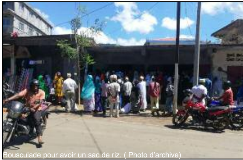
Bousculade pour avoir un sac de riz.

C'était sous un soleil ardent que des longues files d'attentes étaient constituées devant les locaux de l'ONICOR à côté du marché de Fomboni. Une situation dure qui nécessitait d'avoir des reins solides. « Lorsque j'ai appris que le riz « Kayri » sera vendu aujourd'hui, je