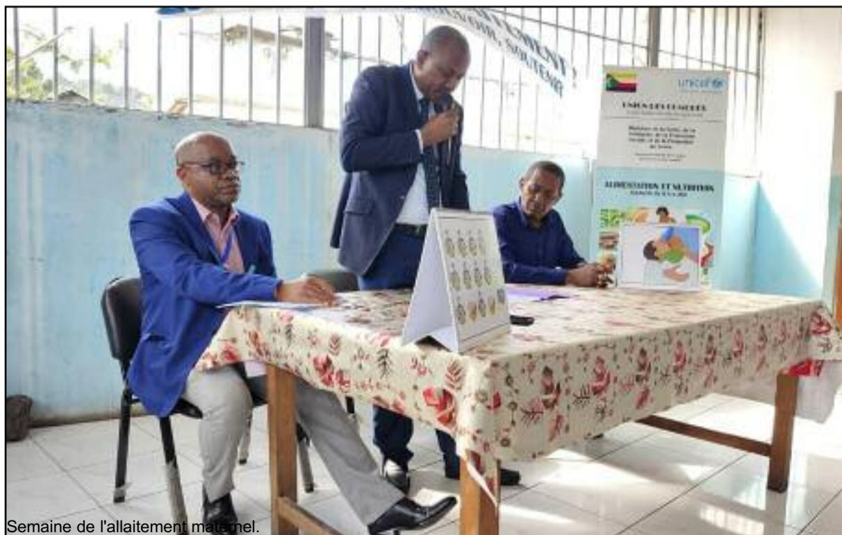
Semaine de l'allaitement maternel.