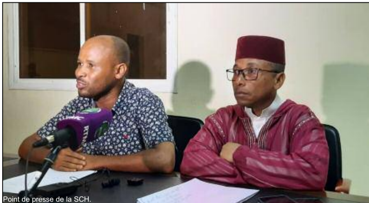
Point de presse de la SCH.