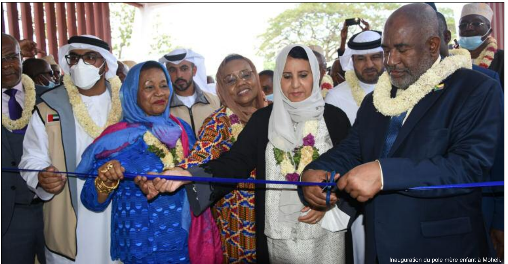
Inauguration du pôle mère enfant à Moheli.