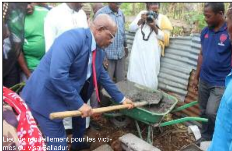
Lieu de recueillement pour les victimes du visa Balladur.

Cette mosquée de vendredi est un symbole et mémoire des plus de 20 000 morts ensevelis dans le bras de mer entre Mayotte et Anjouan. Ce grand projet (mémorable) du locataire de Dar Nadjah est lancé la semaine dernière par la pose de la première pierre à