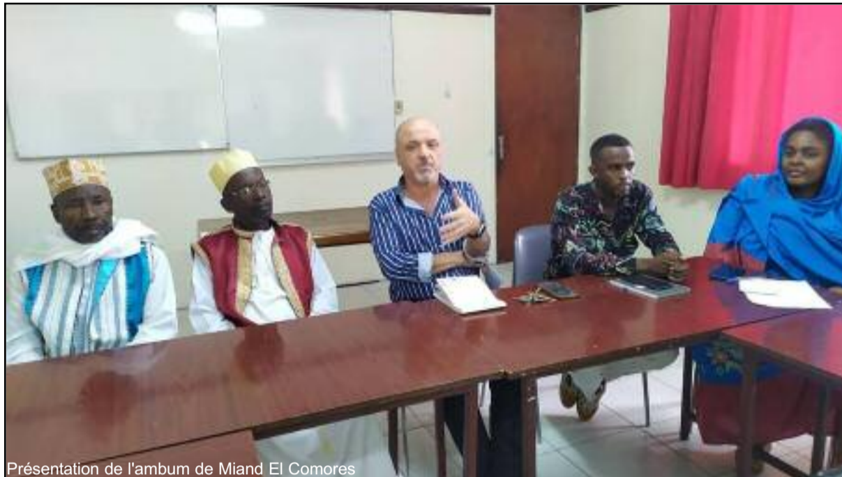
Présentation de l'album de Miand El Comores