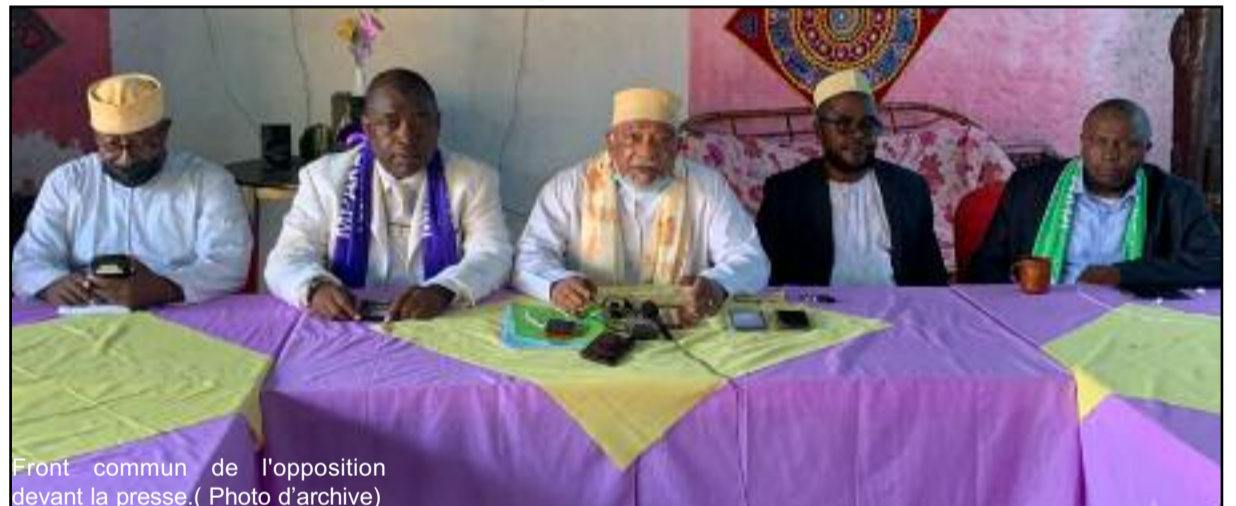
Front commun de l'opposition devant la presse.