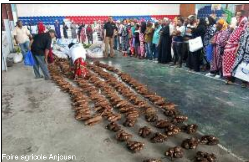
Foire agricole Anjouan.