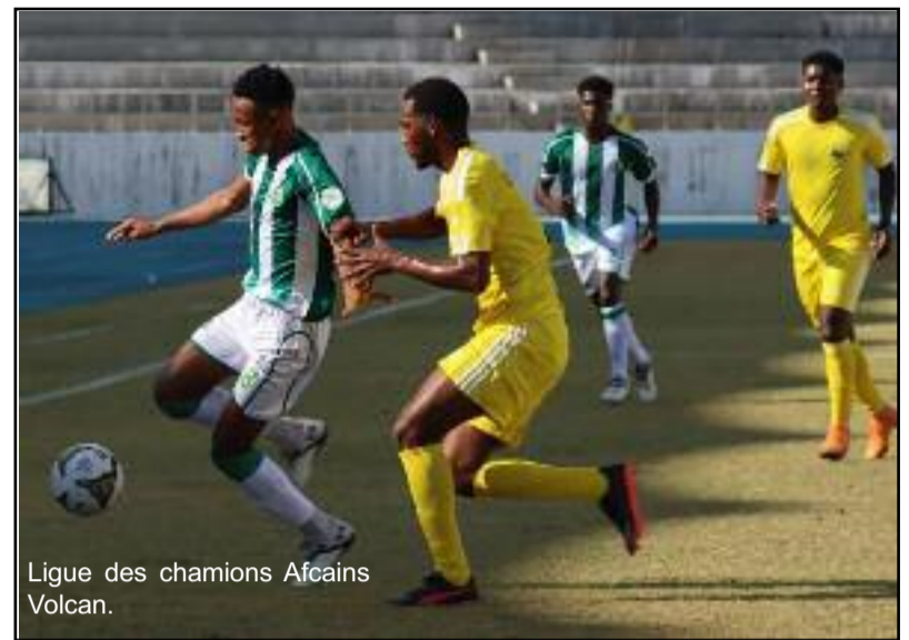
Ligue des champions Afcains Volcan.