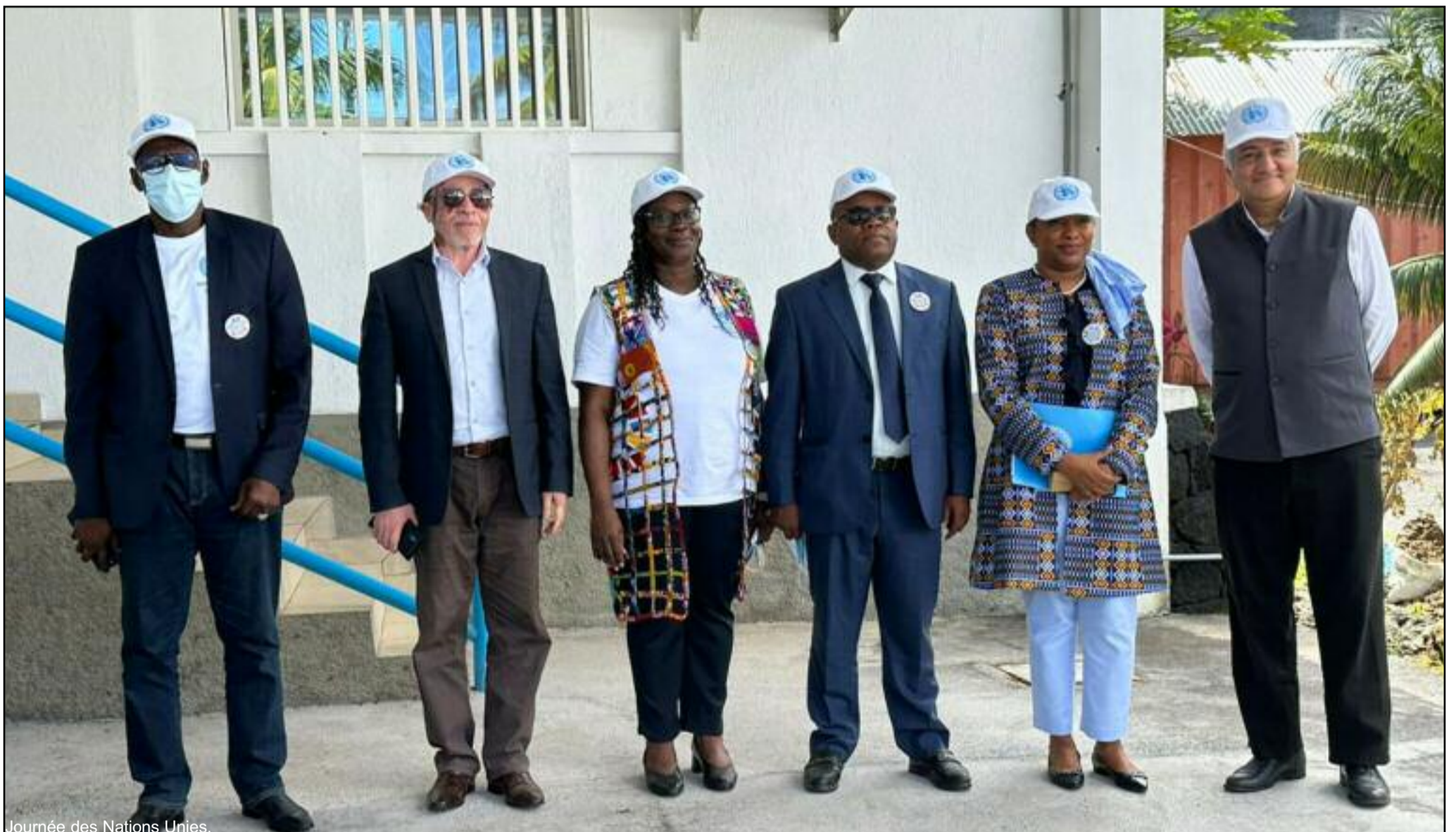
Journée des Nations Unies.