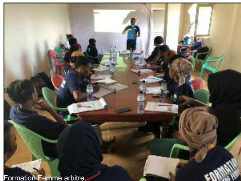
Formation Femme arbitre.