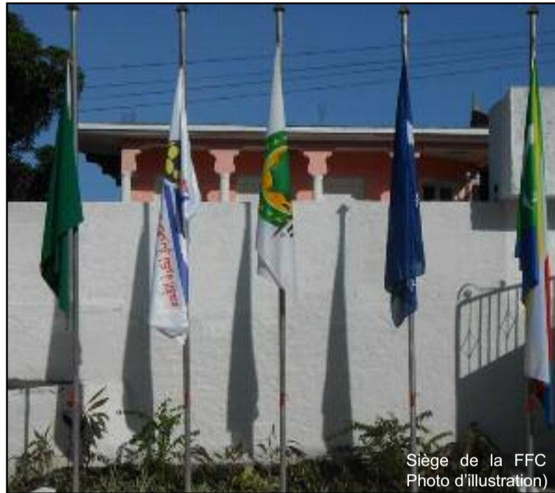
Siège de la FFC Photo d'illustration

Cette formation qui est de dimension nationale, regroupe une douzaine d'instructeurs sélectionnés sur dossiers. « C'est sur dossier que nous avons fait la sélection de ceux qui sont là aujourd'hui à suivre cette formation », montre avec satisfaction le DTN Ayoub