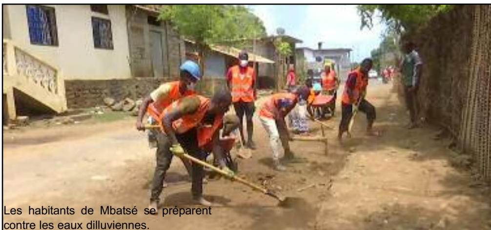
Les habitants de Mbatsé se préparent contre les eaux dilluviennes.