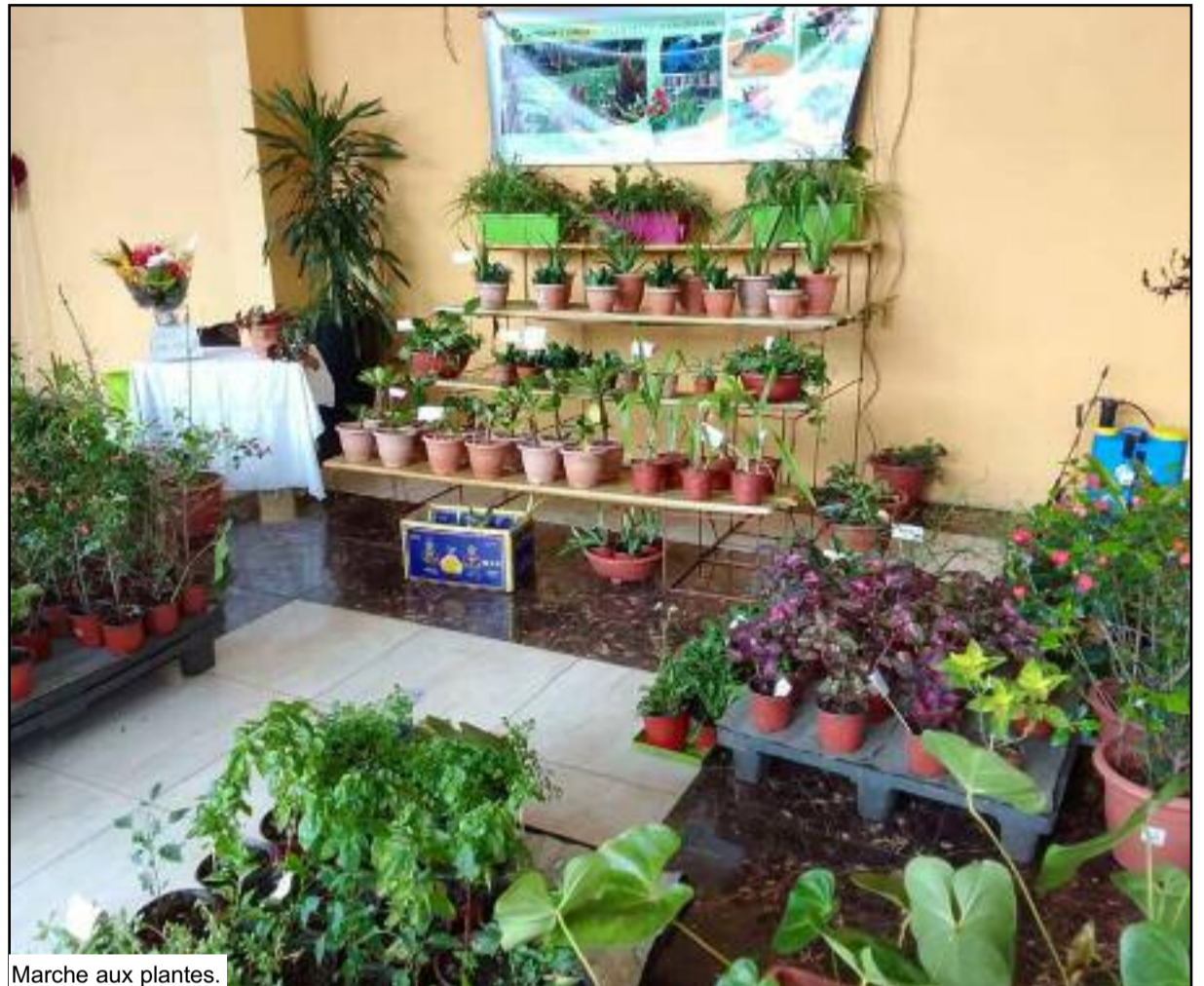
Marche aux plantes.