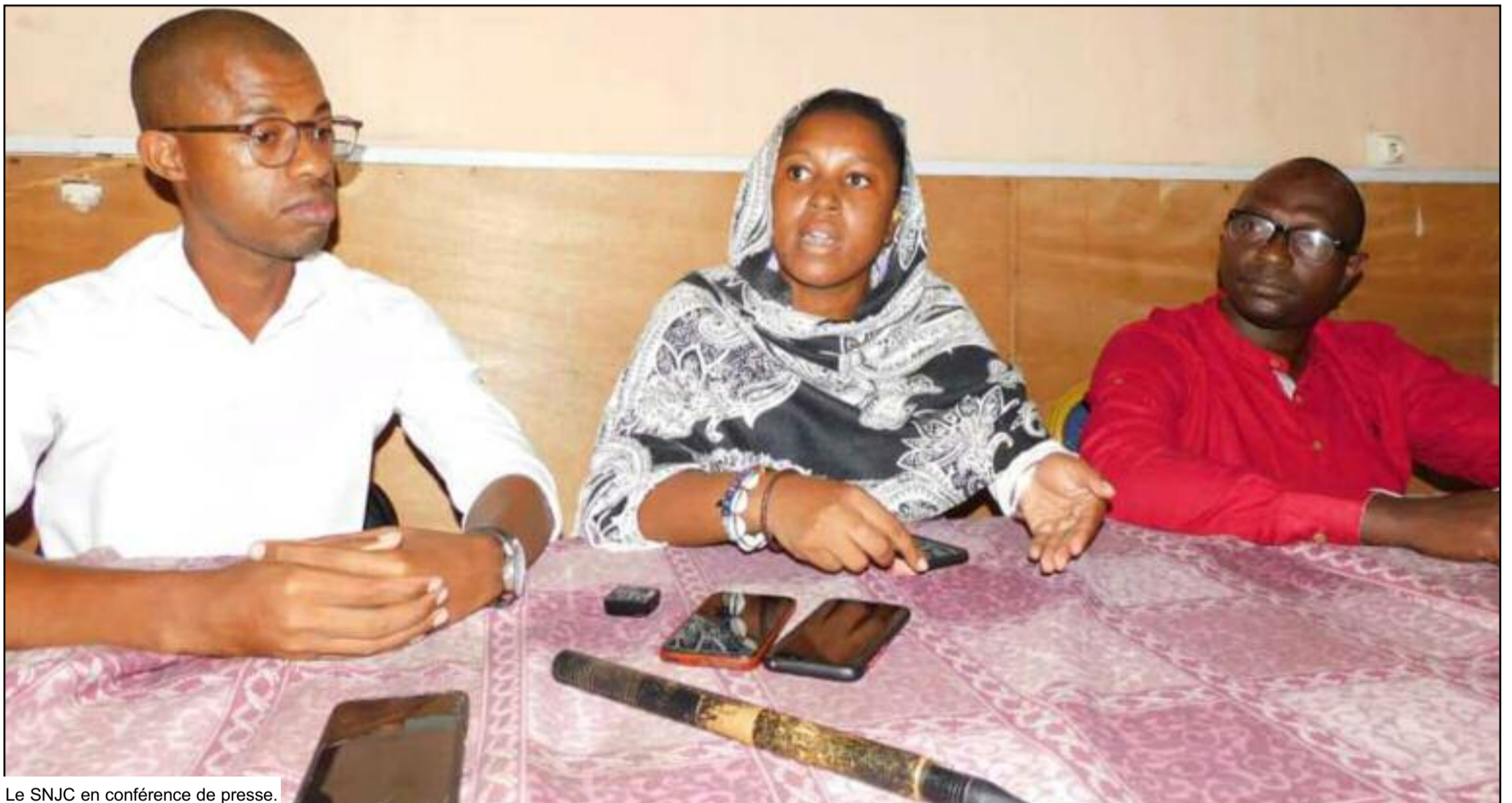
Le SNJC en conférence de presse.