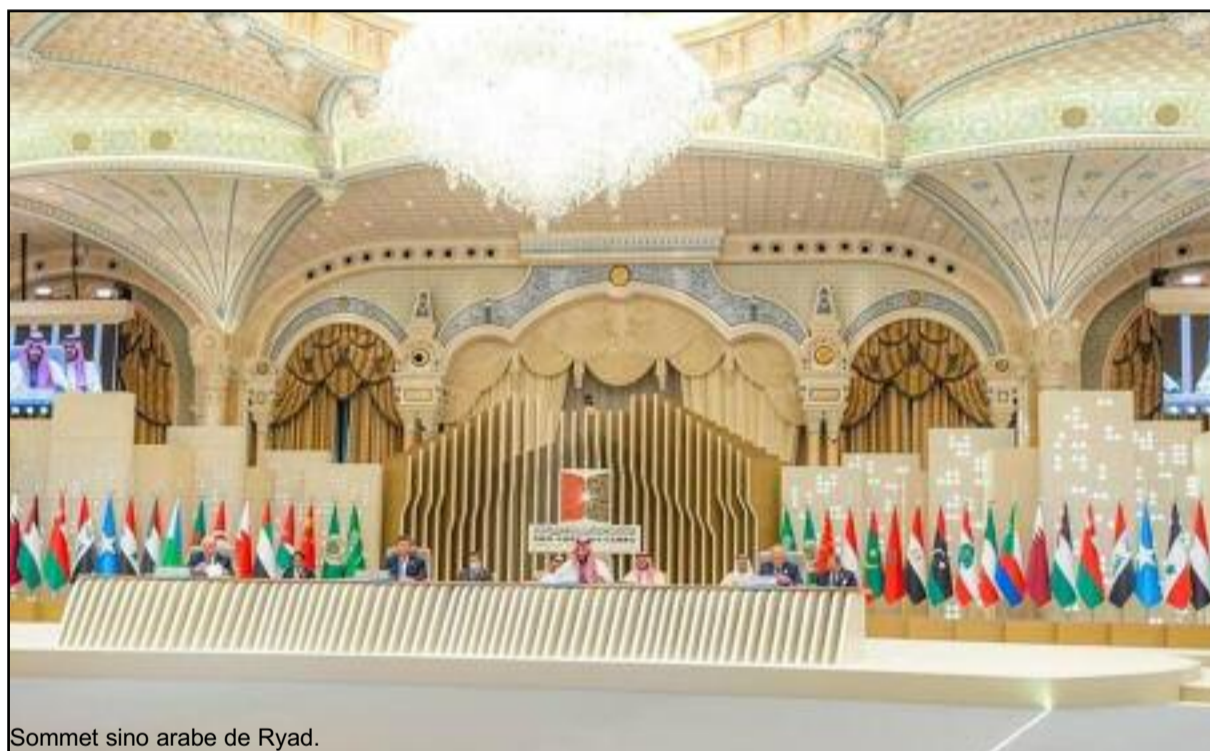
Sommet sino arabe de Ryad.

« Le sommet sino-arabe s'est employé à renforcer la construction pour faire face à la crise alimentaire, énergétique, et s'est engagé à trouver des solutions politiques aux questions épineuses et à œuvrer pour le maintien de la paix et la sécurité dans la région, et appelle à atteindre le bénéfice mutuel et à renforcer la