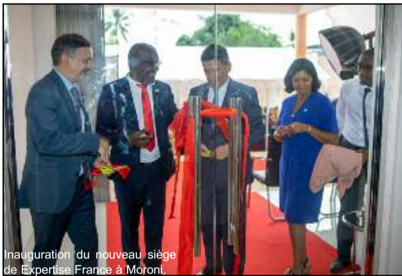
Inauguration du nouveau siège de Expertise France à Moroni.