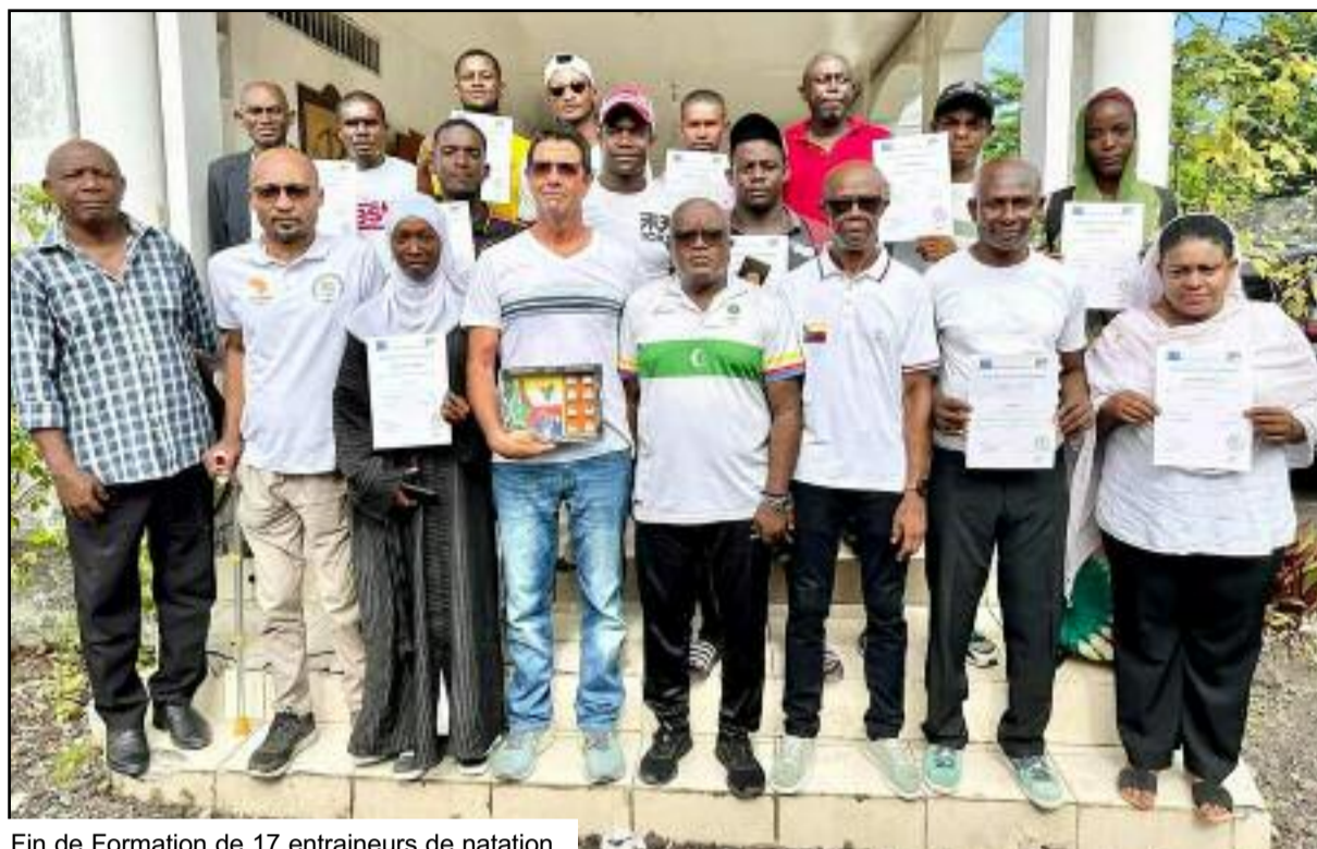
Fin de Formation de 17 entraîneurs de natation.