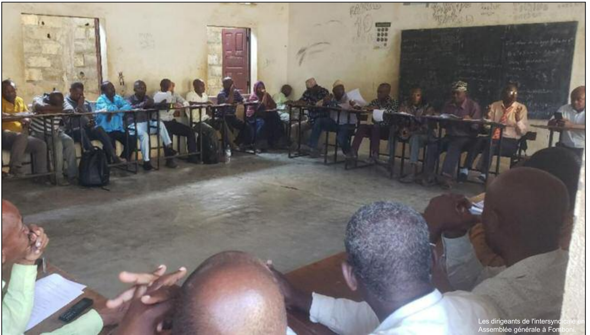
Les dirigeants de l'intersyndicale en Assemblée générale à Fomboni.