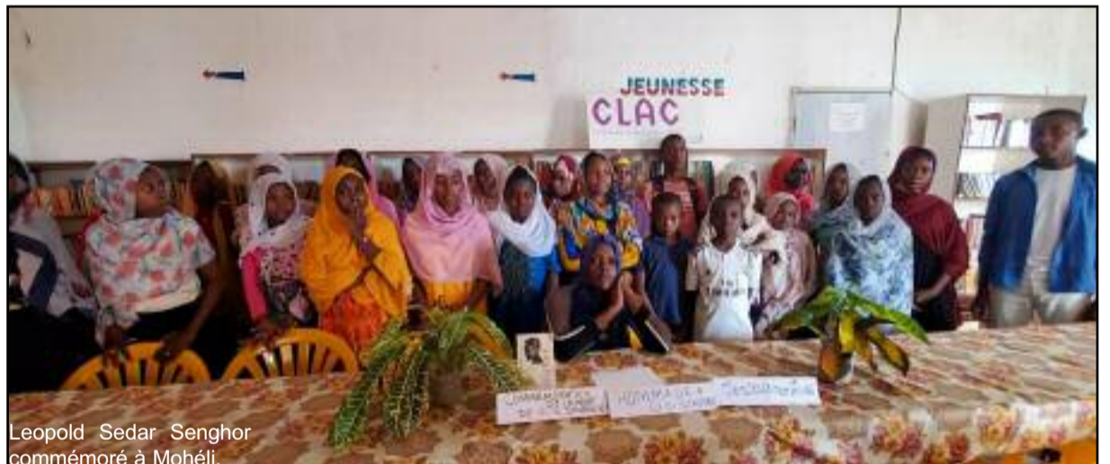
Leopold Sedar Senghor commémoré à Mohéli.