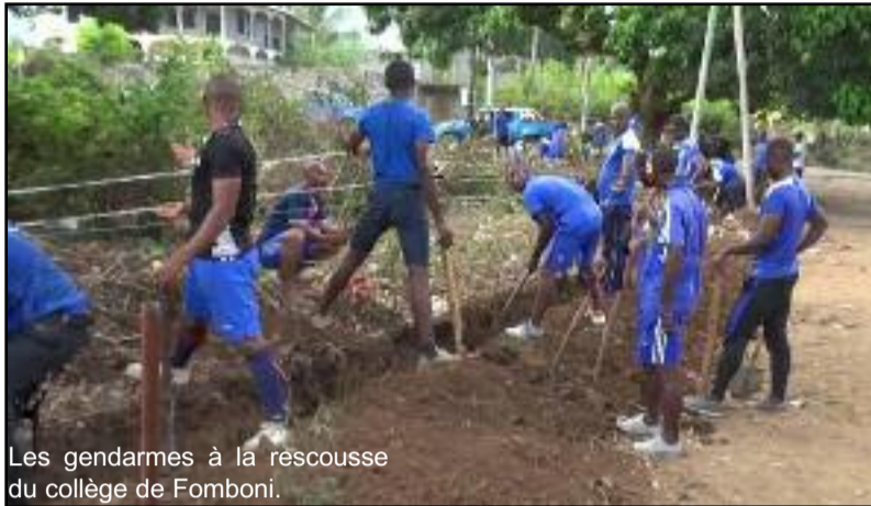
Les gendarmes à la rescousse du collège de Fomboni.

Les responsables du collège rural de Fomboni ont lancé un SOS à toutes les bonnes volontés pour que cet établissement scolaire ait enfin une clôture. Chacun apporte sa contribution mais la gendarmerie nationale est la première institution à répondre présent.