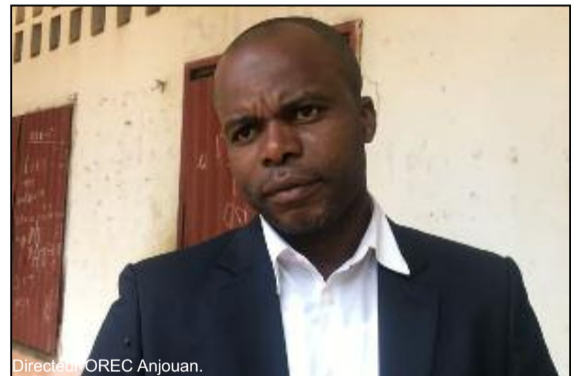
Directeur OREC Anjouan.