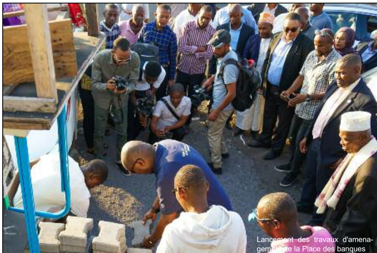
Lancement des travaux d'aménagement de la Place des banques

Pour les bailleurs, à savoir Exim Bank et IFC, deux entités qui se définissent comme des entreprises citoyennes, il est important de mani-