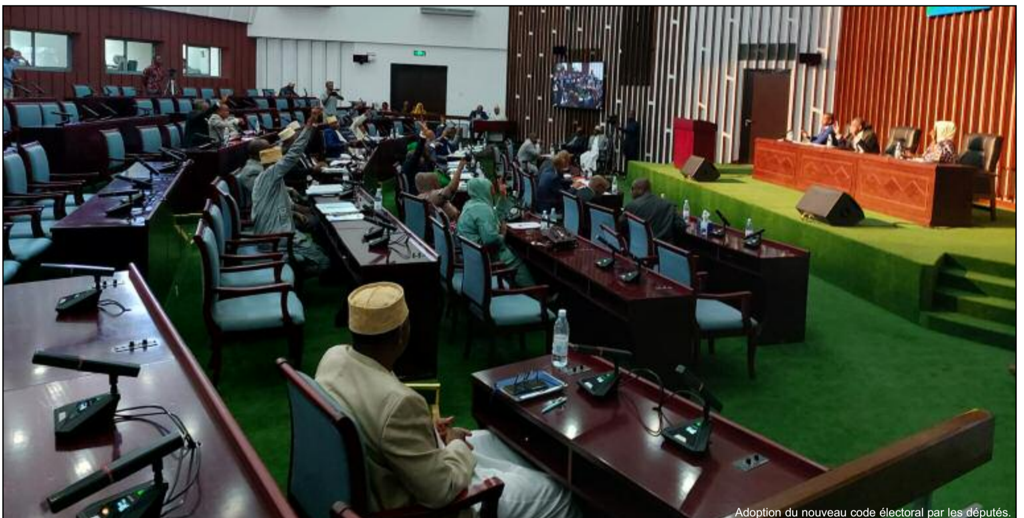
Adoption du nouveau code électoral par les députés.

Après un long débat sur la question de l'amendement porté par le gouvernement s'agissant de l'élection des conseillers communaux, notamment sur la voix consultative des chefs de villages et de quartiers à l'élection des maires, le projet de loi portant code électoral a été, sans surprise, adopté par l'assemblée nationale.