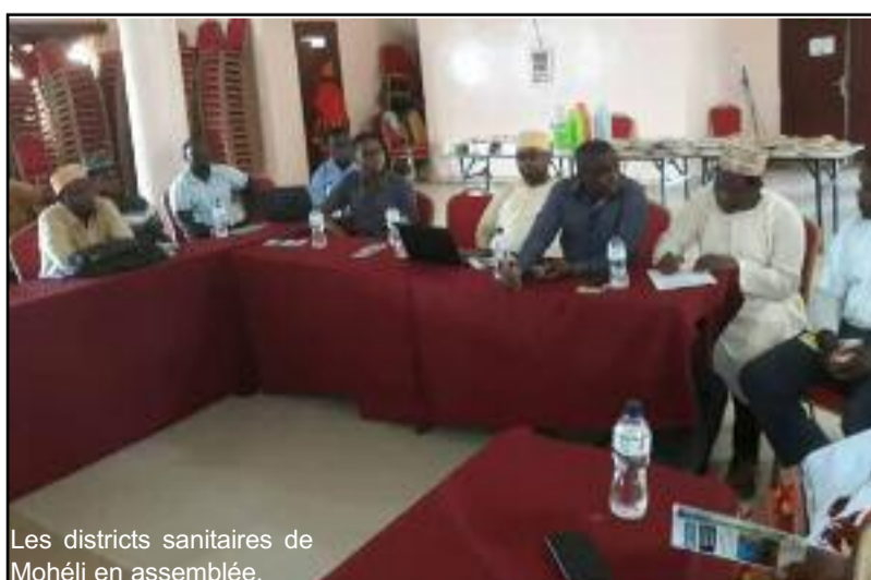
Les districts sanitaires de Mohéli en assemblée.