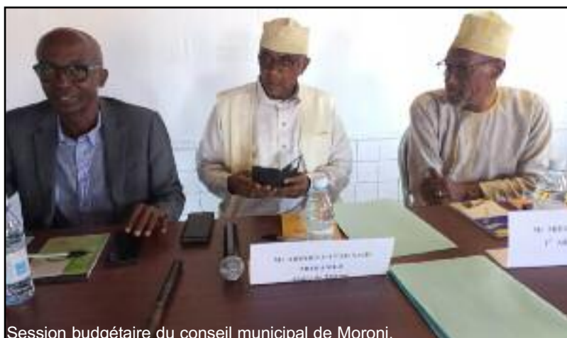
Session budgétaire du conseil municipal de Moroni.