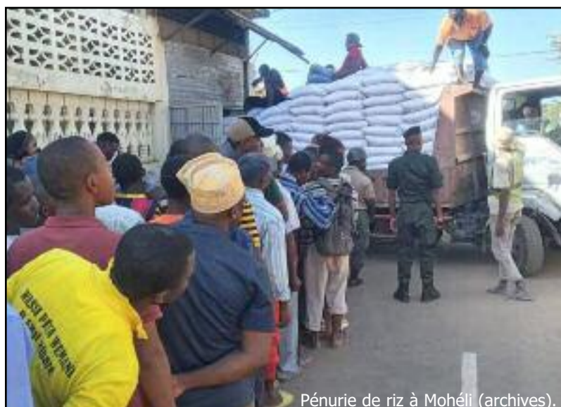
Pénurie de riz à Mohéli (archives).