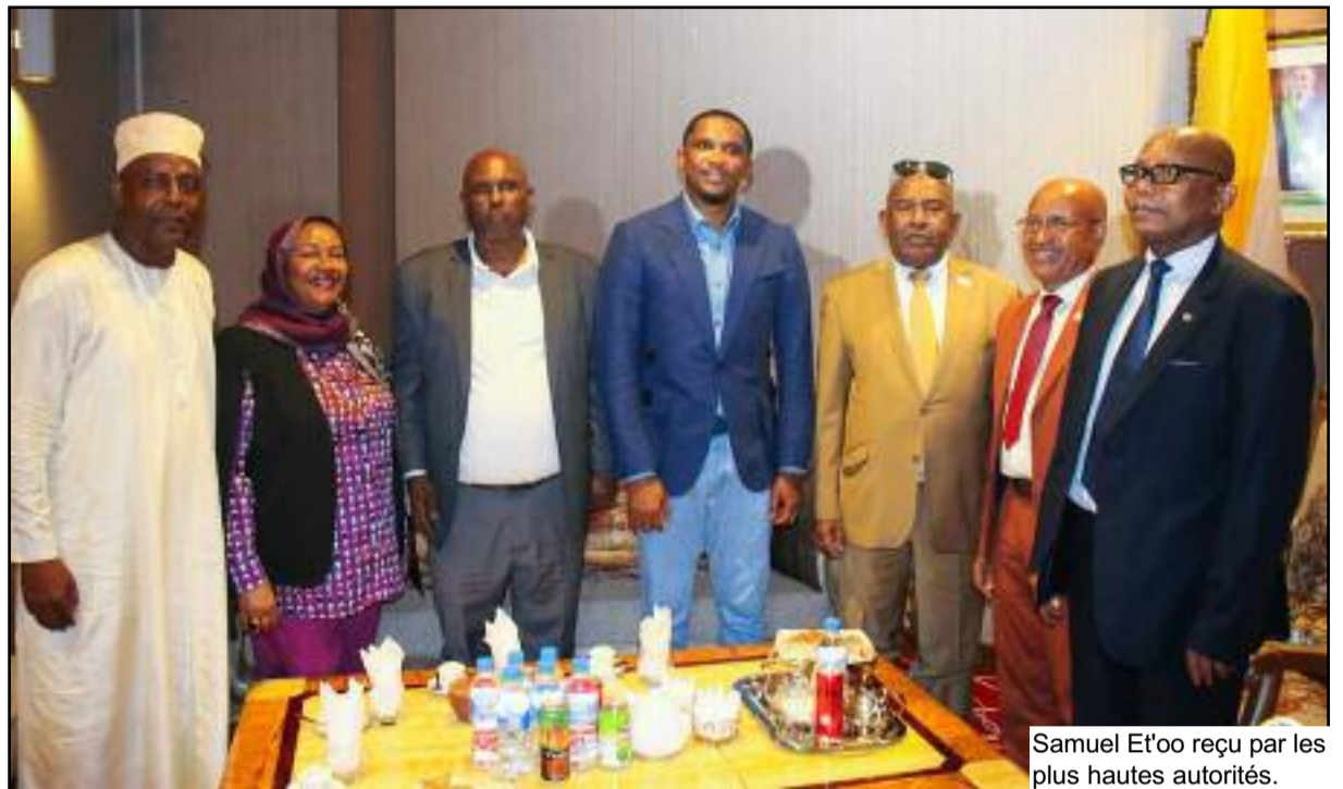
Samuel Eto'o reçu par les plus hautes autorités.