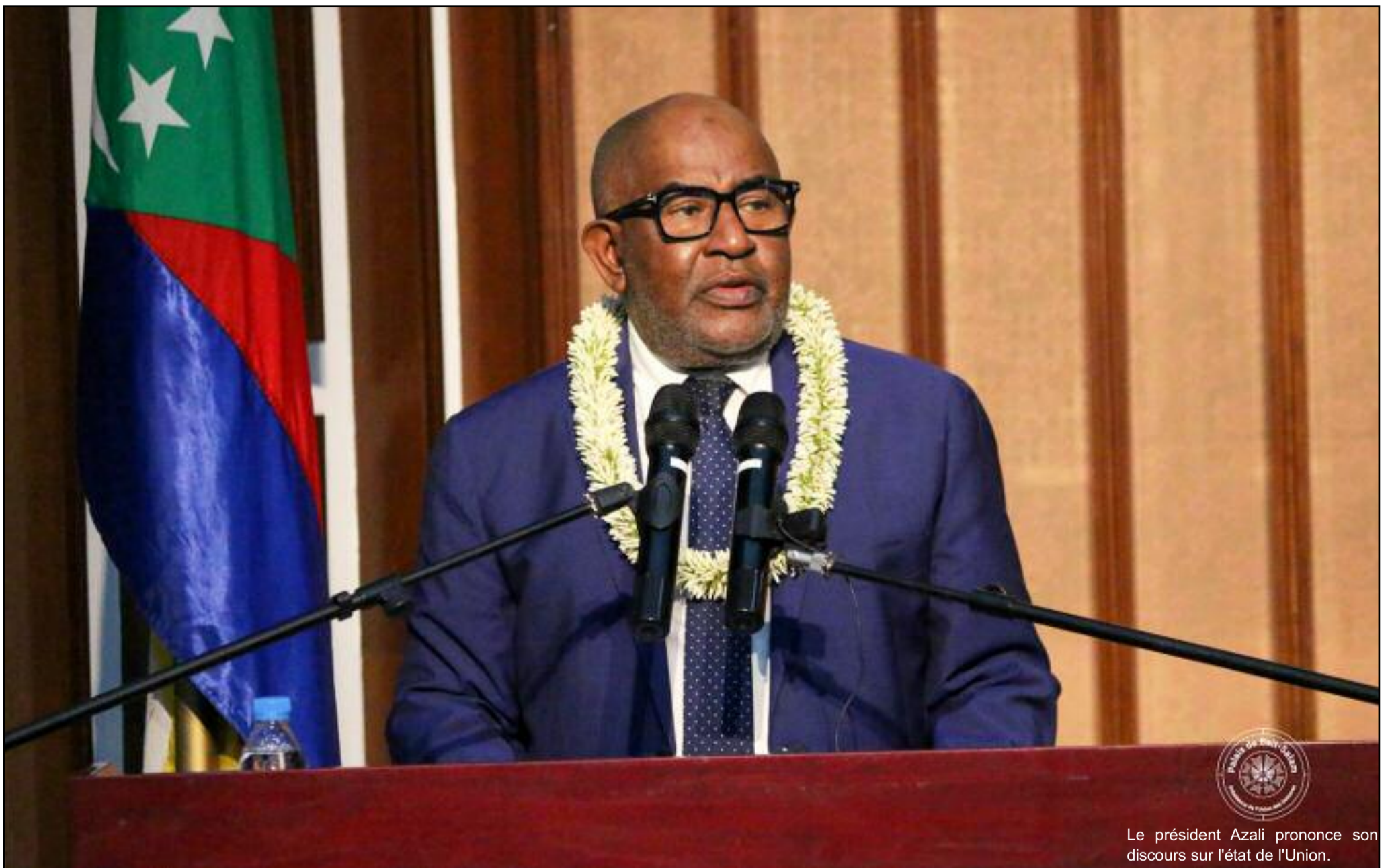
Le président Azali prononce son discours sur l'état de l'Union.

Adoption de plusieurs projets de lois, plan économique et financier, sécurité, énergie, infrastructures etc., rien n'a été oublié dans son discours sur l'Etat de la nation devant le parlement le vendredi 30 décembre dernier. En course pour la présidence de l'Union Africaine, le chef de l'Etat Azali Assoumani a peint un tableau visiblement reluisant de son action de l'année qui vient de s'écouler.