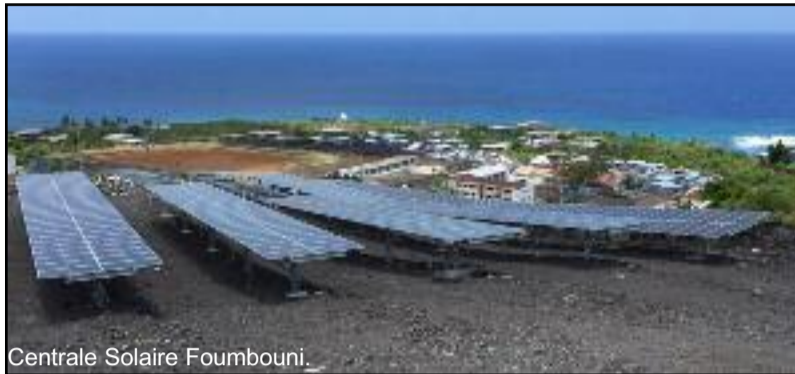
Centrale Solaire Foubouni.