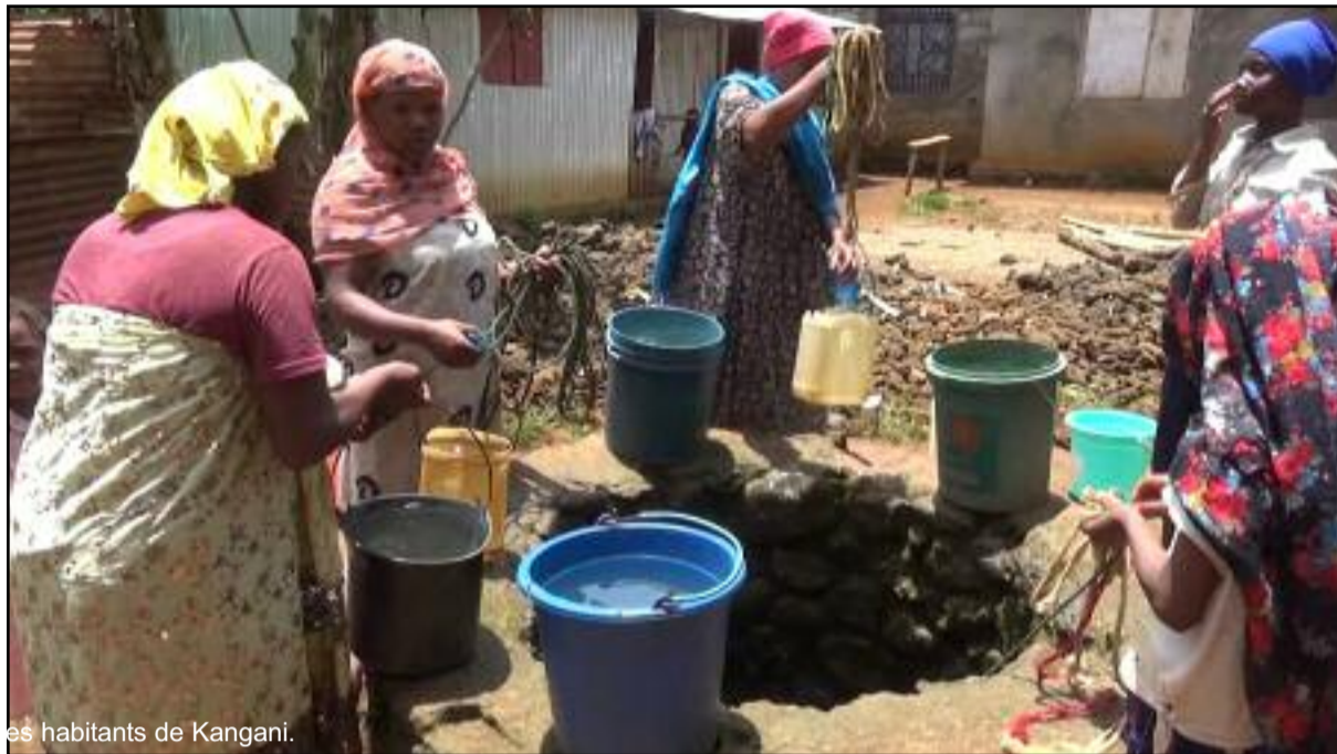
Les habitants de Kangani.

Les habitants de Kangani, un village de la région de Djando vivent depuis quelques semaines sans eau potable. Pour assurer les besoins ménagers de tous les jours, les femmes de cette localité passent presque la moitié de la journée à puiser de l'eau de puits. Elles font la queue chaque matin dans les différents puits du village à la recherche de ce liquide précieux. Sceaux sur la tête et des jerricanes à la main tous les jours, les femmes de Kangani se disent