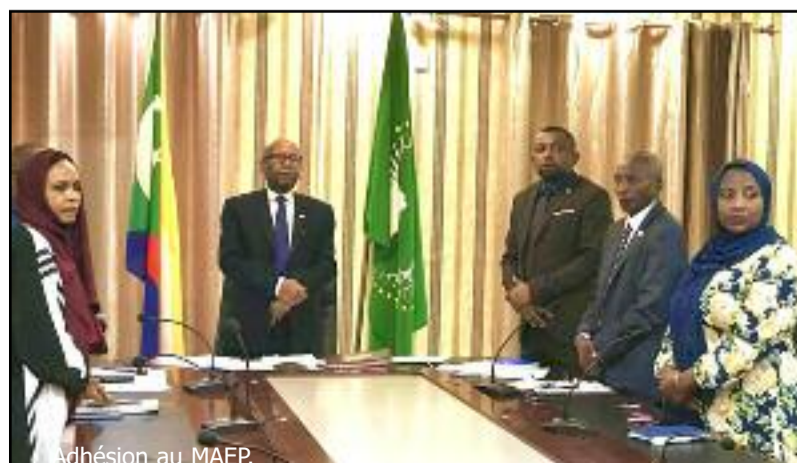
Adhésion au MAEP.