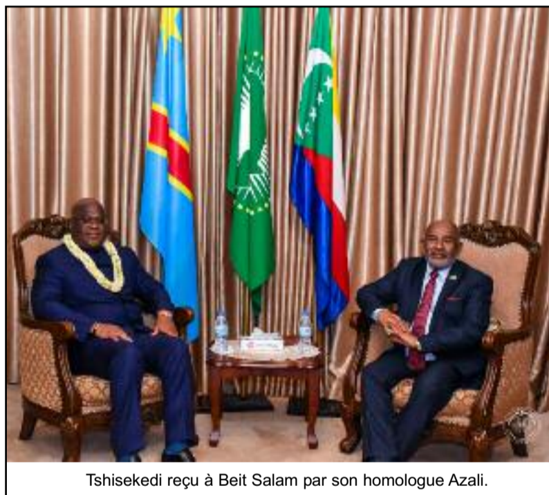
Tshisekedi reçu à Beit Salam par son homologue Azali.

Pour le président Azali Assoumani, la venue du président Félix Tshisekedi est pour venir témoigner son soutien pour les responsabilités continentales qu'il va assurer. « Maintenant avec ce qui se passe en Ukraine on ne peut pas attendre l'Europe pour nous trouver une solution. On a intérêt à trouver une solution à nous », a déclaré le