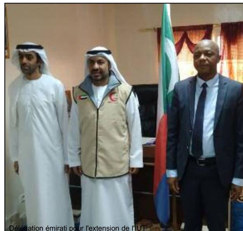
Délégation émirati pour l'extension de l'IUT