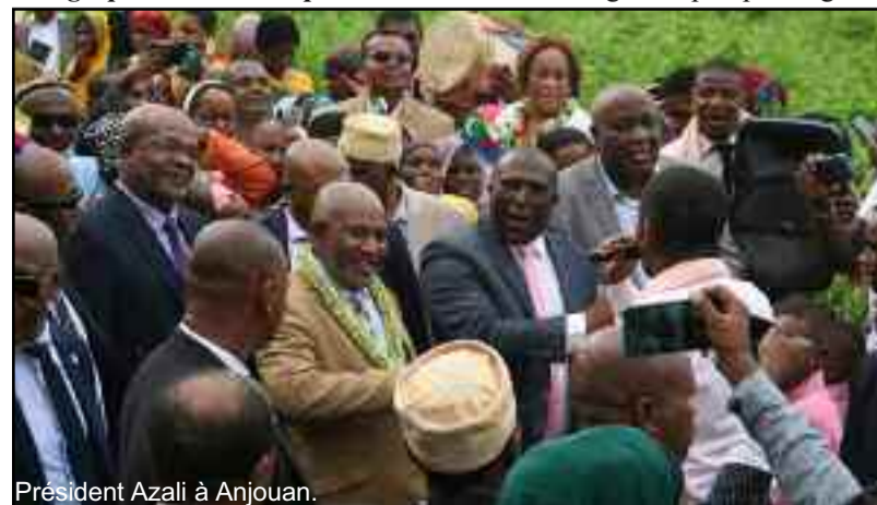
Président Azali à Anjouan.