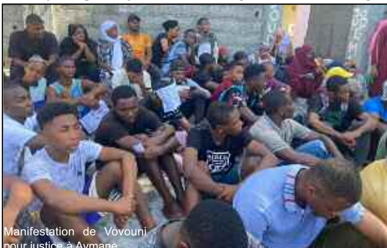
Manifestation de Vouvouni pour justice à Aymane.