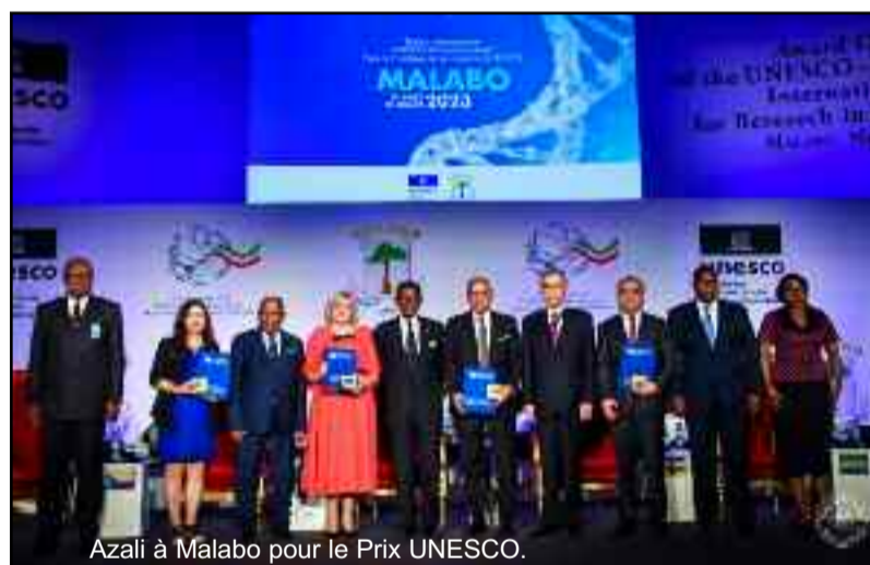
Azali à Malabo pour le Prix UNESCO.