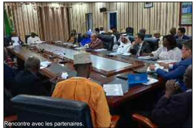
Rencontre avec les partenaires.