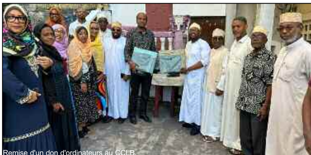
Remise d'un don d'ordinateurs au CCLB.