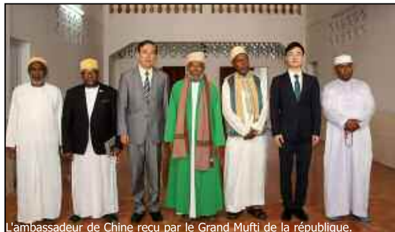
L'ambassadeur de Chine reçu par le Grand Mufti de la république.