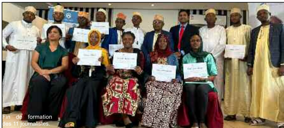
Fin de formation des 11 journalistes.