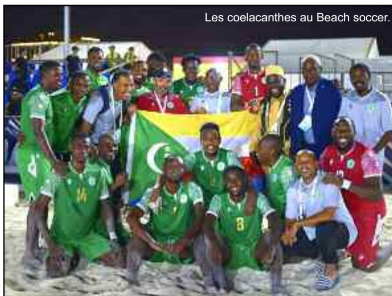
Les cœlacanthes au Beach soccer.

Avec seulement 10 matchs officiels, les Cœlacanthes du Beach-Soccer sont encore dans la phase d'apprentissage mais, la volonté et l'envie de bien faire qu'ils sont entraînés de démontrer dans cette coupe arabe laisse croire que d'ici peu, les Comores seront parmi les meilleurs formations arabes et pourquoi pas africaines. Ce volontarisme s'est tout de même heurté lundi dernier à la réalité du jeu contre le tenant du