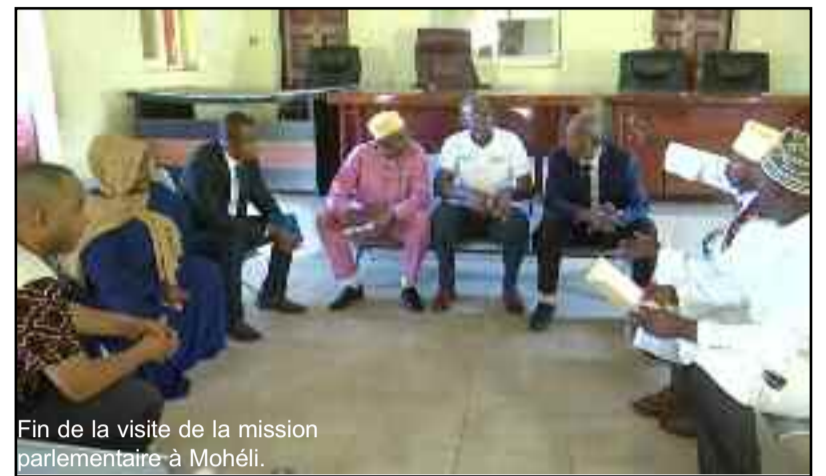
Fin de la visite de la mission parlementaire à Mohéli.

La rencontre s'est poursuivie à la mairie de Fomboni et au centre hospitalier de référence insulaire de Fomboni avec les sages-femmes du pôle mère-enfant. Ceci car ce sont les sages-femmes qui effectuent les premières déclarations de naissance d'un bébé. Lesquelles déclarations permettent aux parents de faire établir l'extrait d'acte de naissance du nouveau-né. Une campagne de sensibilisation auprès de la population locale sur les avantages de ce nouveau système aura lieu prochainement, avant de former les officiers