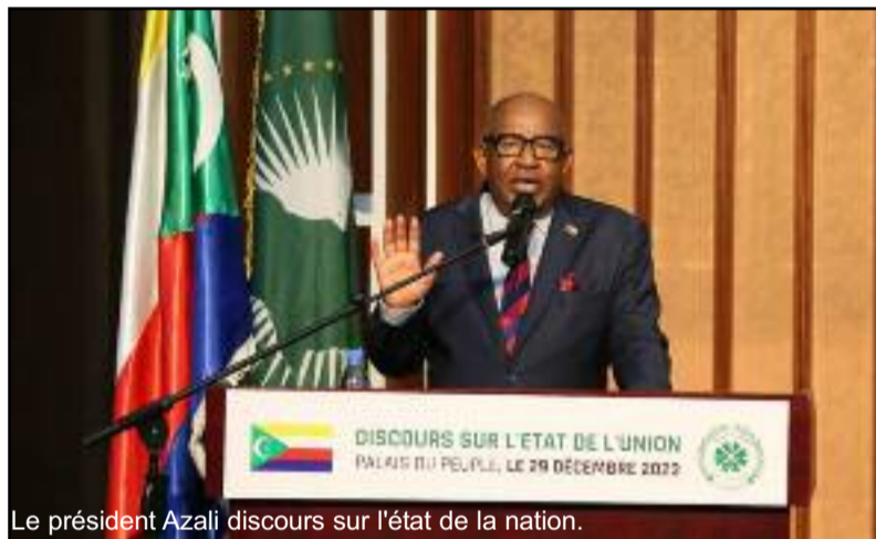
Le président Azali discours sur l'état de la nation.

Par ailleurs, il a salué le travail accompli par les institutions et structures en charge des élections et l'accompagnement précieux des partenaires extérieurs. Selon lui beaucoup reste à faire, des ajustements, des améliorations et des adaptations sont toujours nécessaires. « Toutefois, nous ne devons jamais nous départir de la responsabilité qui est la nôtre, de pérenniser nos institutions qui, depuis une vingtaine d'années, ont permis des alternances politiques pacifiques, opposition et pouvoir, au Sommet de l'Etat, renforcer la gouvernance, la démocratie, la liberté et la cohésion sociale. C'est pourquoi, je voudrais très sincèrement, remercier l'ensemble des Comoriennes et des Comoriens, pour leur engagement citoyen et leur sens du patriotisme, qui constituent des gages de cohésion sociale et un rempart, contre