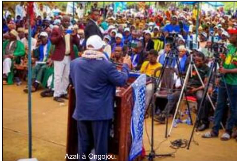
Azali à Ongojou.