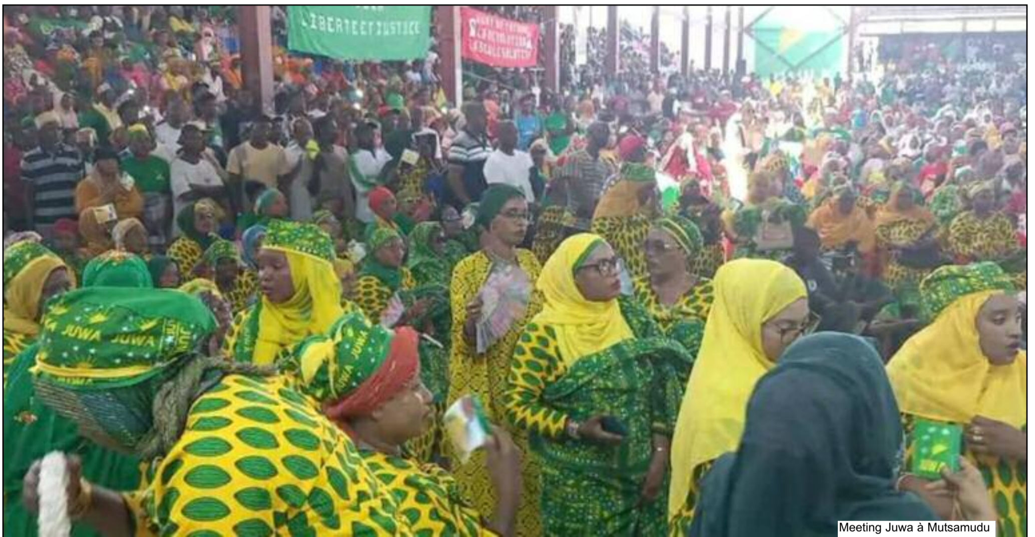
Meeting Juwa à Mutsamudu

L' arrivée à Anjouan hier lundi 1er janvier du candidat soutenu par le parti Juwa a été un triomphe. Entre 9000 et 10 000 personnes venant des quatre coins de l'île ont déferlé à l'aéroport de Ouani pour accueillir Dr