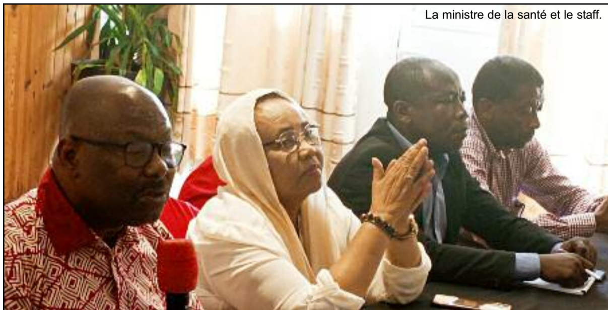
La ministre de la santé et le staff.

Dans le cadre de ses activités de sensibilisation et de prévention en milieu scolaire, l'ONG Santé Diabète, en partenariat avec le ministère de la santé a lancé une formation de trois jours sur la prévention du diabète destinée aux enseignants des écoles primaires, des directeurs d'écoles et animateurs associatifs de Ngazidja. Ils étaient 12 enseignants, 6 directeurs d'écoles et 9 animateurs associatifs qui ont bénéficié de cette formation qui a pour but de renforcer les capacités des participants sur le diabète et ses facteurs de risques. « Cette formation permet également de sensibiliser les participants sur la prévention, la maîtrise d'usage des outils d'animation, le mode ali-