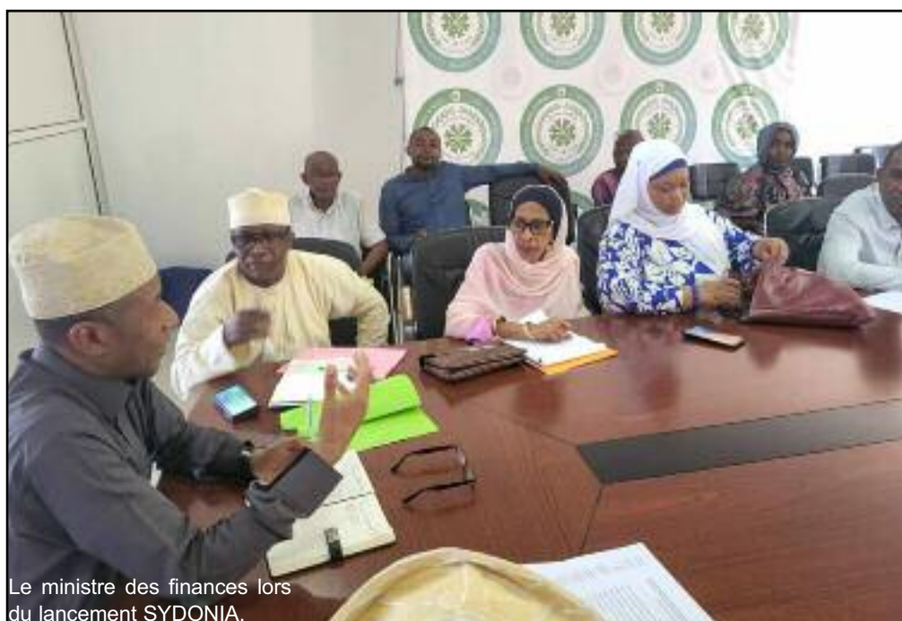
Le ministre des finances lors du lancement SYDONIA.