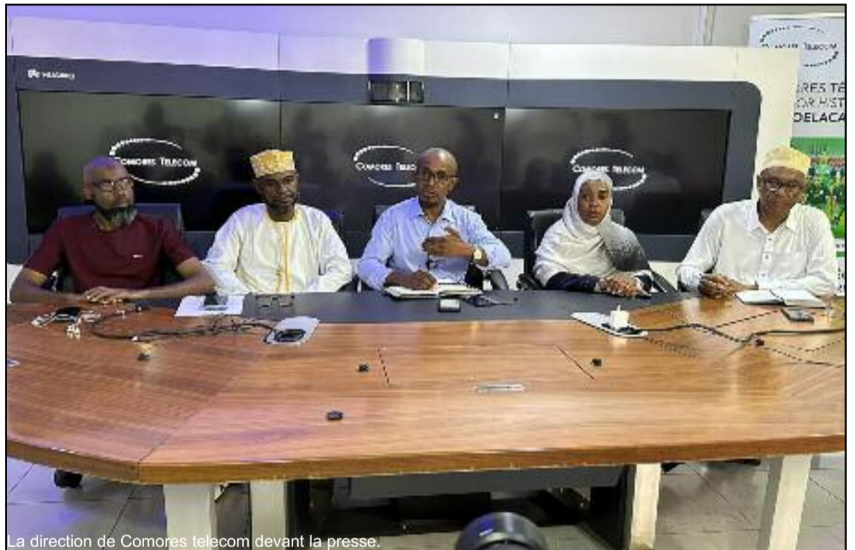
La direction de Comores telecom devant la presse.

Pour rappel, ce n'est pas la première fois que la société Comores Télécom rencontre des perturbations sur ses réseaux. Ses utilisateurs ont été privés de communication du 28 au 29 août dernier à 12h. Ils ne pouvaient plus communiquer ni via SMS, appel et encore moins internet. Ce qui avait provoqué une vague de protestation des consommateurs