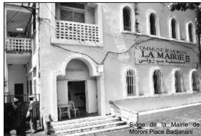
Siège de la Mairie de Moroni Place Badjanani

Et de poursuivre « c'est dans ce sens que l'exécutif communal, reconduit en priorité les actions du programme de l'exercice précédent et sollicite la collaboration et l'appui de ses partenaires étatiques, du secteur privé et de la société civile, pour apporter leur soutien à la dyna-