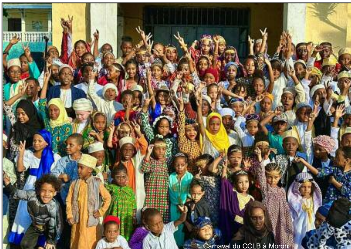
Carnaval du CCLB à Moroni