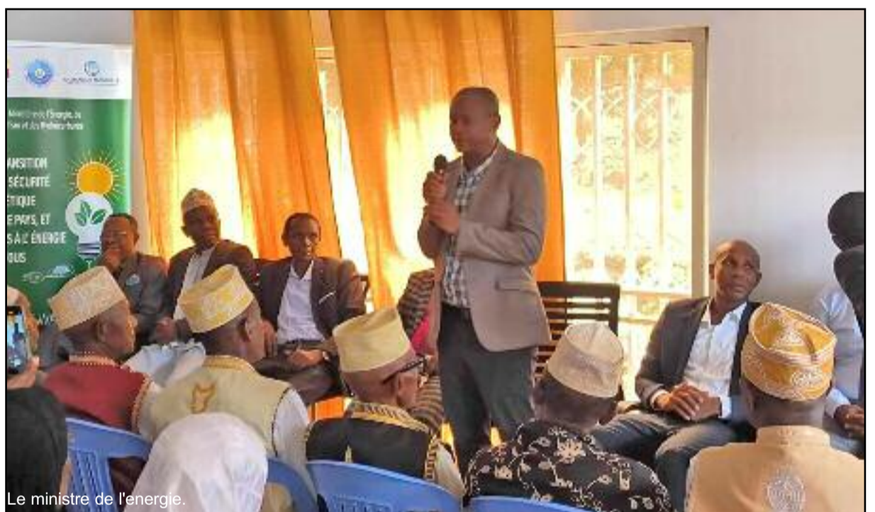
Le ministre de l'énergie.