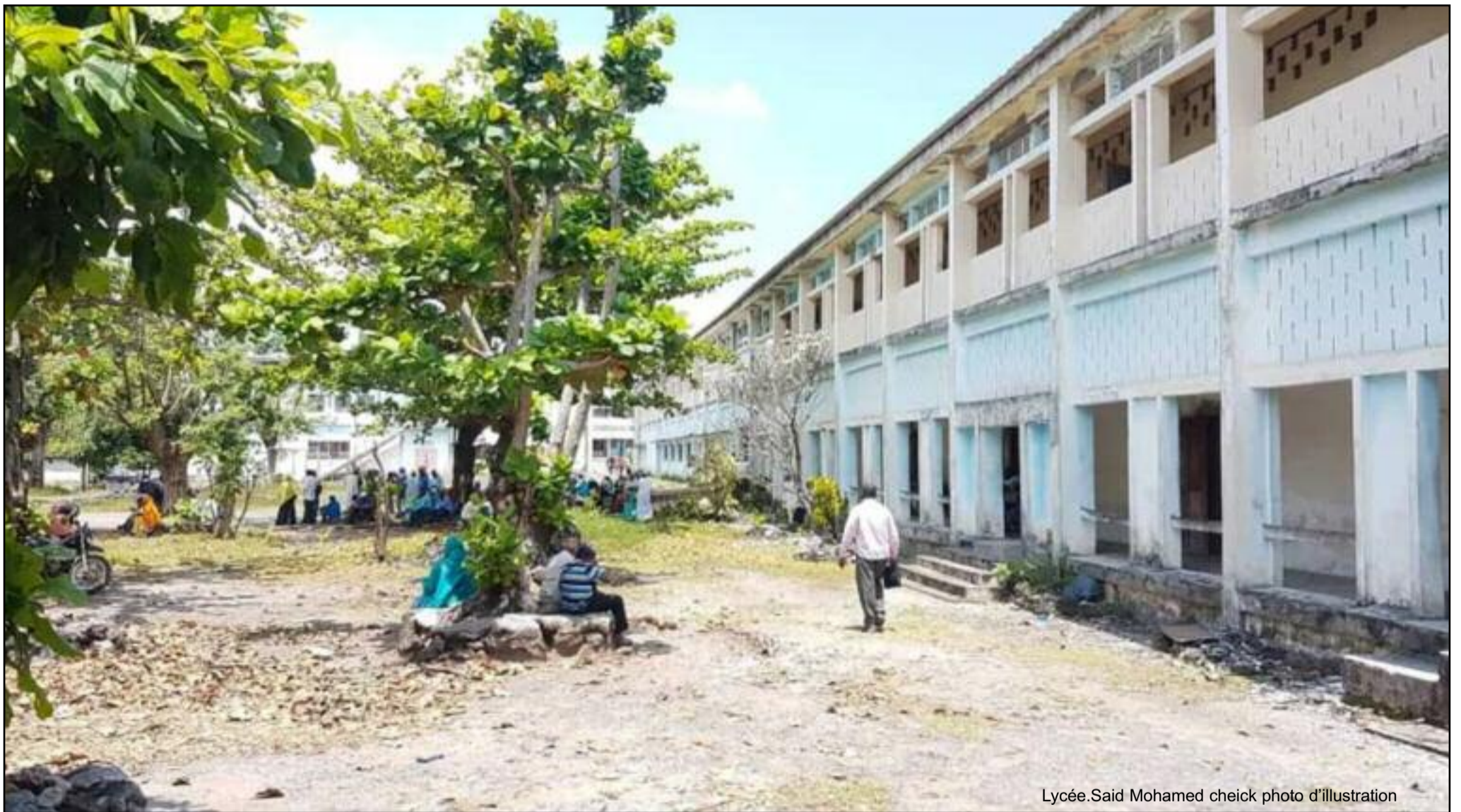
Lycée.Said Mohamed cheick photo d'illustration

Depuis le mois de janvier, des centaines d'enseignants comoriens font face à une situation désastreuse. Il s'agit des salaires incomplets en raison de dysfonctionnements administratifs. Bien que la direction générale du budget (DGB) ait promis une régularisation rapide, les enseignants se sentent oubliés et s'interrogent sur les causes réelles de ce problème persistant.