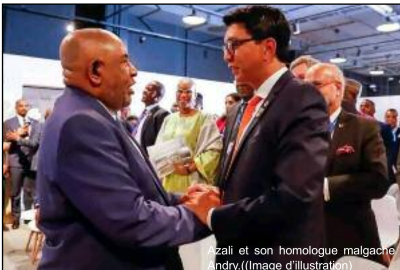
Azali et son homologue malgache Andry. (Image d'illustration)

la Banque centrale des Comores, a fait l'objet de vives tensions entre les deux pays. Dernier épisode, l'interdiction de débarquer au port de Majunga des passagers en provenance des Comores, fin 2024. La raison évoquée : la résurgence du choléra en Union des Comores. S'il est vrai que dans l'archipel le choléra circulait encore, le niveau n'était pas aussi alarmant que cela. La décision unilatérale des autorités malgaches a été dénoncée par Moroni sans parvenir à fléchir le grand voisin. Quelques jours auparavant, Azali Assoumani avait refusé de recevoir la ministre malgache des affaires étrangères, émissaire de son homologue Andry Rajoelina. Ce n'est qu'au début de ce mois de mars que le gouvernement malgache a décidé la réouverture des frontières maritimes. Même si Moroni, dans le cadre de la donation des 49 kilogrammes des lingots d'or, mise beaucoup plus sur la réouverture des frontières aériennes, fermées depuis la période de la Covid-19.