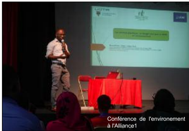
Conférence de l'environnement à l'Alliance1

tique n'est pas seulement un déchet visible, mais un danger invisible.