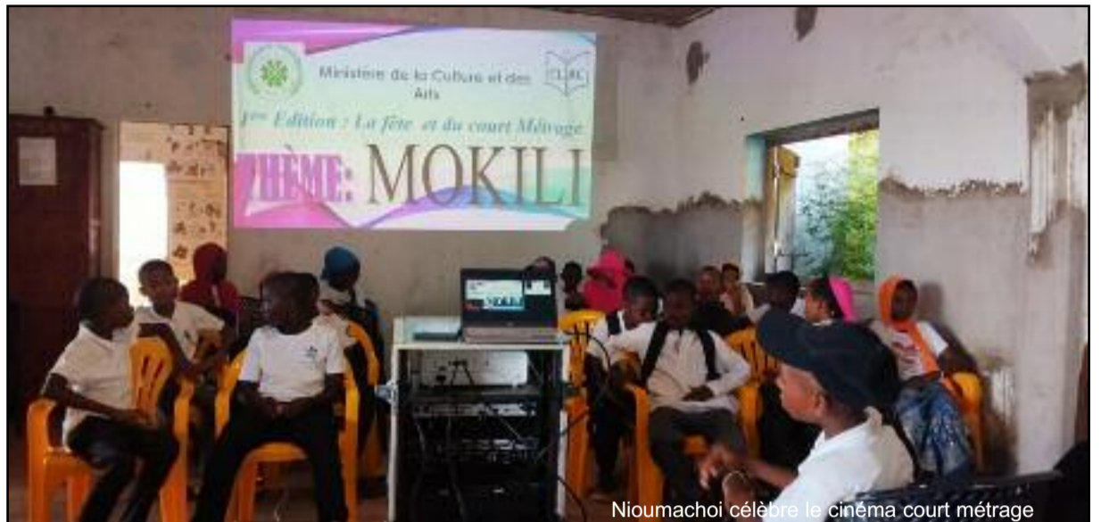
Nioumachoi célèbre le cinéma court métrage

Au total, 56 participants, majoritairement issus du centre, ont pris part à cette activité. Le film, présenté comme une fable sociale au propos volontairement appuyé, a captivé l'audience en dressant un portrait saisissant de la jeunesse africaine contemporaine. Entre réalités scolaires, tensions familiales, amitiés tumultueuses et dérives sociales (drogue, corruption, mariages forcés) Mokili explore avec finesse les multiples facettes de l'adolescence. L'œuvre est également marquée par la présence d'un personnage singulier, un sage marginal rappelant la figure du philosophe antique Diogène de Sinope, qui ponctue le récit de réflexions profondes, dont cette interrogation centrale : « Où allons-nous dans ce monde ? ».