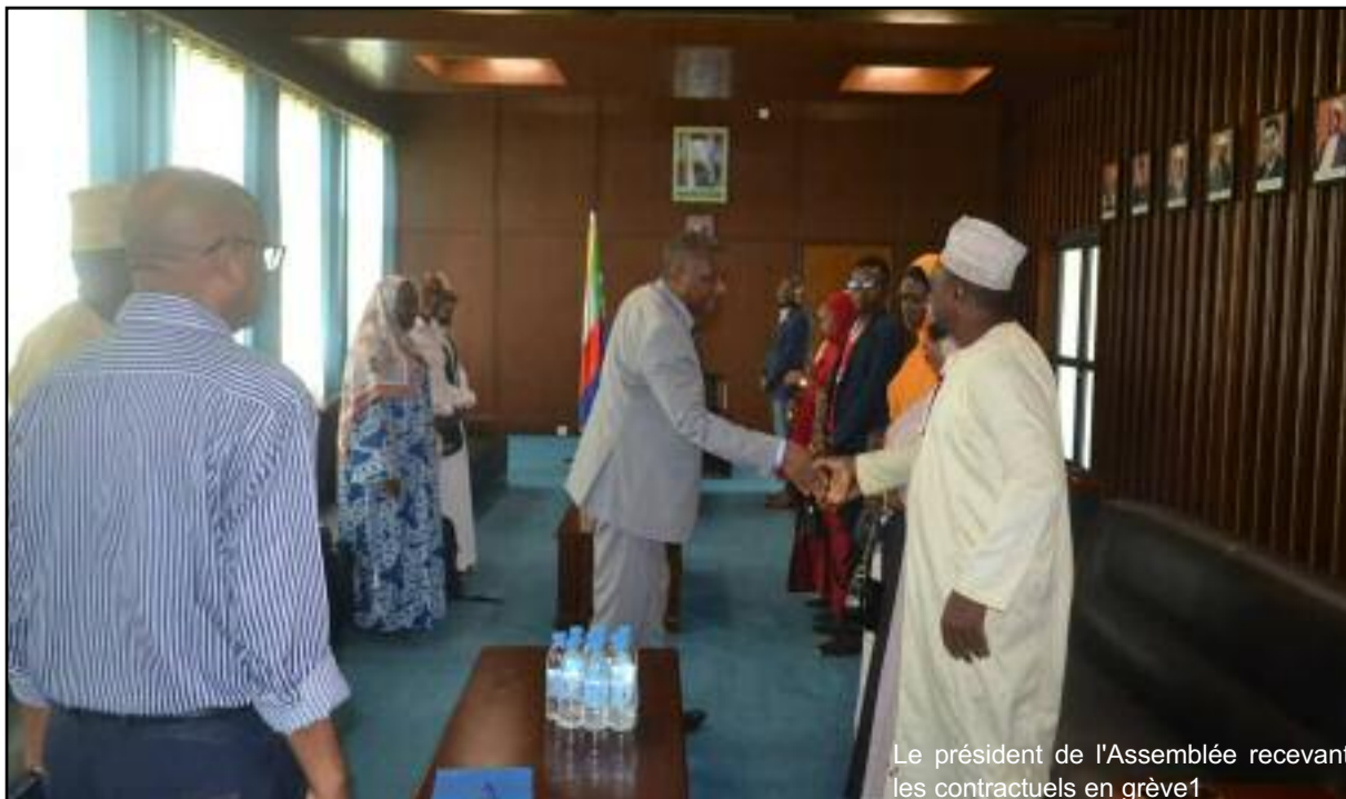
Le président de l'Assemblée recevant les contractuels en grève 1