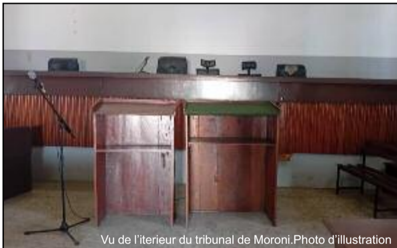
Vu de l'intérieur du tribunal de Moroni. Photo d'illustration