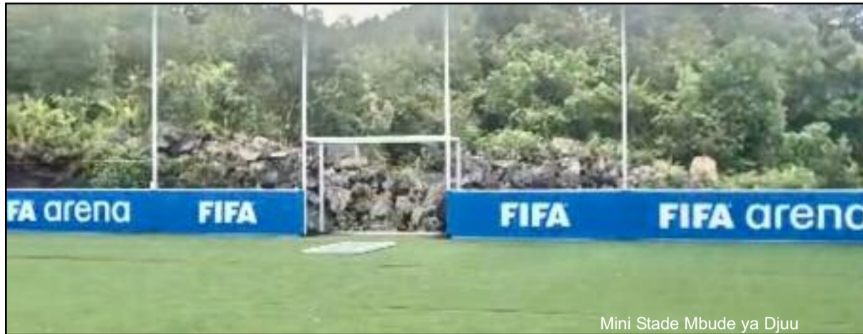
Mini Stade Mbude ya Djuu

Une délégation de la FIFA est attendue à Moroni les prochains jours, pour l'inauguration des mini-stades, dans le cadre du projet ARENA. Plus de cent pays de par le monde ont bénéficié de cet appui de la FIFA pour la construction de ces mini-stades afin de faciliter l'accès aux jeunes à des infrastructures plus sûres et protégées, pour la bonne pratique du football. Plus de 1000 terrains seront érigés un peu partout dans le monde. Et les Comores ne sont pas en reste.