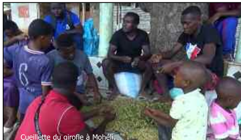
Cueillette du girofle à Mohéli.