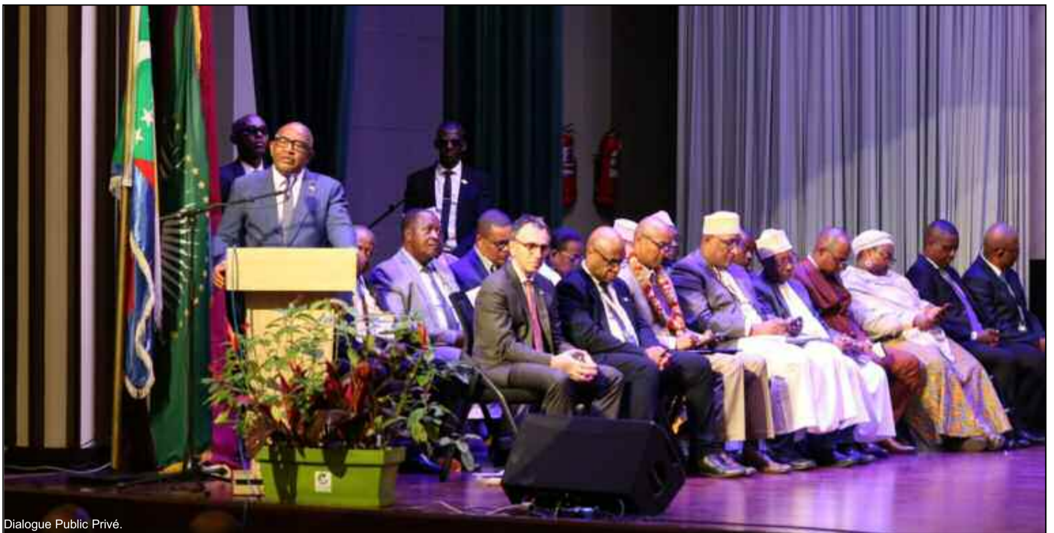
Dialogue Public Privé.

Du 18 au 19 octobre 2023, se tient à Moroni le dialogue public-privé sur l'environnement des affaires. Ce premier forum est fruit de la signature entre l'Etat et le secteur privé qui a eu lieu en 2020 à Anjouan.