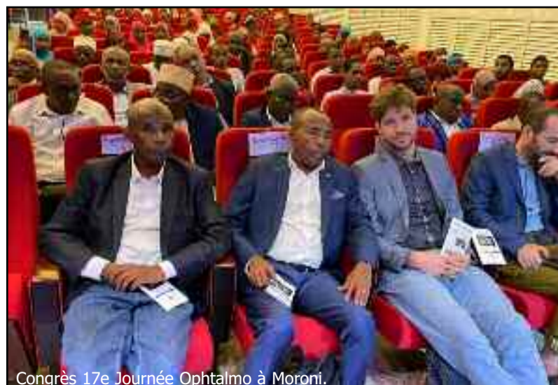
Congrès 17e Journée Ophtalmo à Moroni.