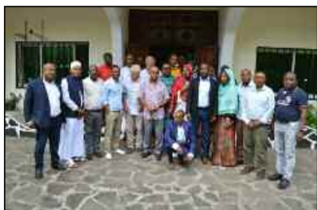
Communiqué de Presse Pour diffusion immédiate

LES 27 ET 28 NOVEMBRE 2023, A L'HOTEL ZARA