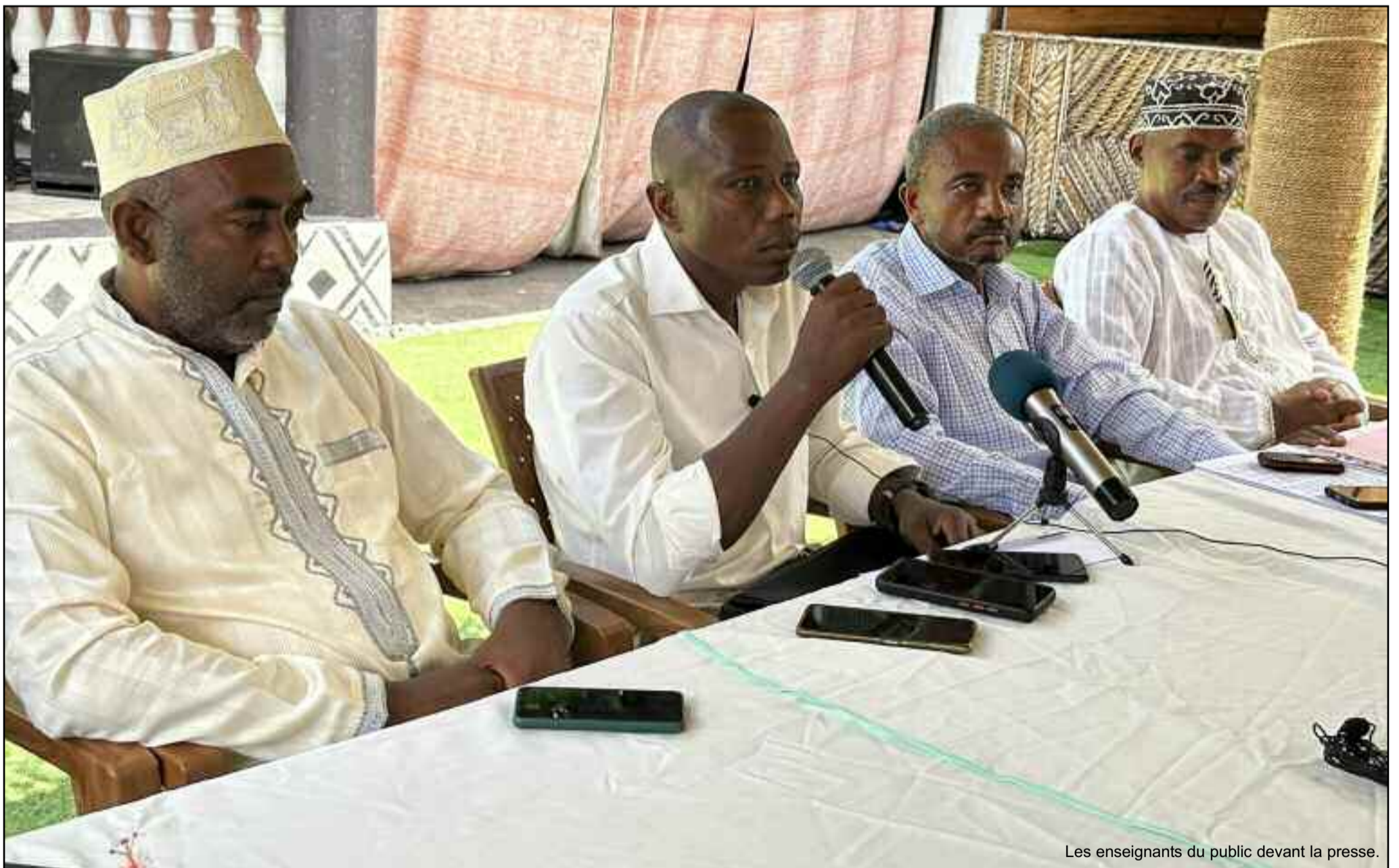
Les enseignants du public devant la presse.

Le bras de fer entre les enseignants du public et le gouvernement continue. Les enseignants refusent de reprendre les cours malgré la menace grandissante d'une année blanche. Preuve de leur inflexibilité, ils répètent à tout bout de champ que « la sour-