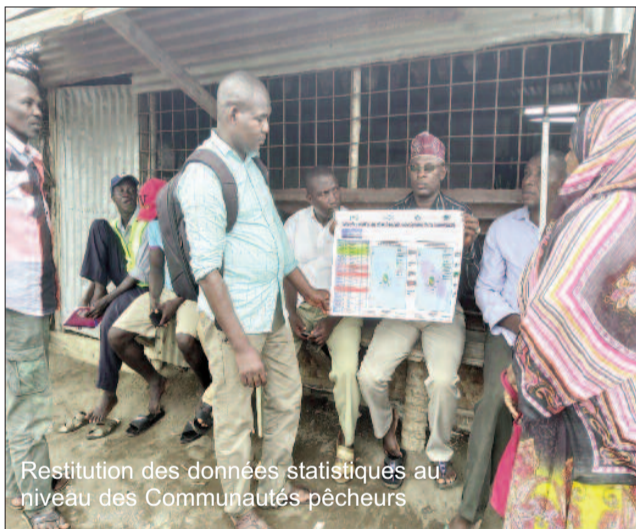
Restitution des données statistiques au niveau des Communautés pêcheurs