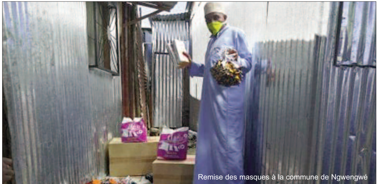
Remise des masques à la commune de Ngwengwé

Le premier lot est composé entre autres de masques, de savon liquide, des lingettes anti bactériennes et d'autres détergents destinés aux centres et postes de santé locaux, notamment le centre de santé maternel et infantile de Démbeni et le poste de santé sis à Tsinimoichongo. « C'est un petit pas mais on va y revenir pour un autre geste », promet-il. Au même