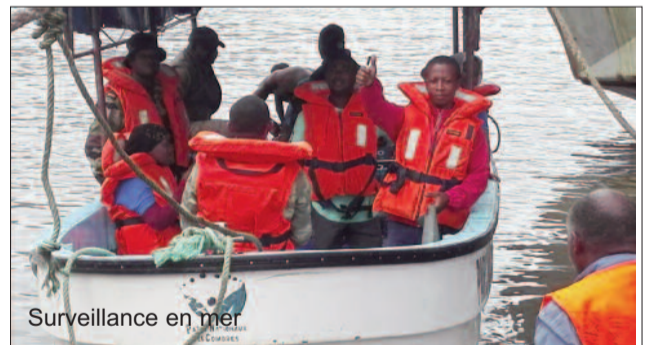
Surveillance en mer