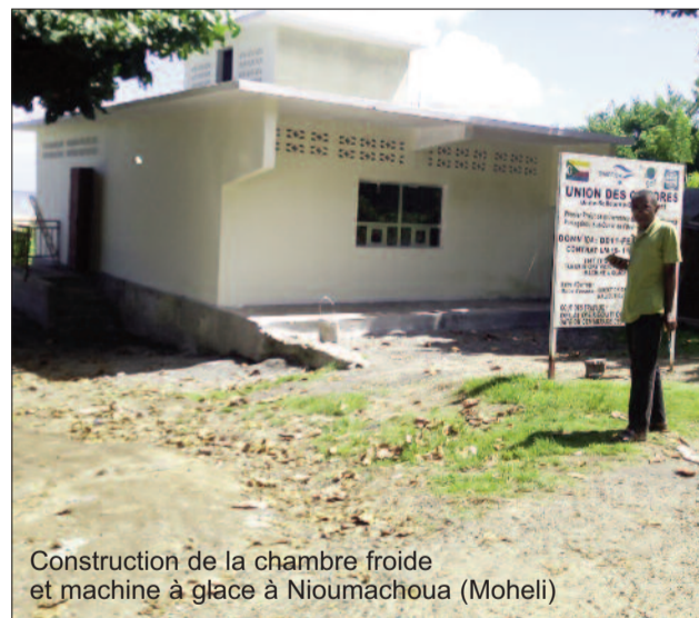
Construction de la chambre froide et machine à glace à Nioumachoua (Mohéli)