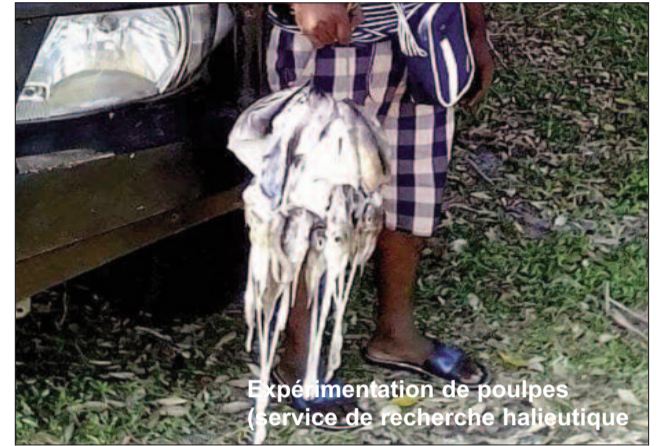
Expérimentation de poulpes (service de recherche halieutique)