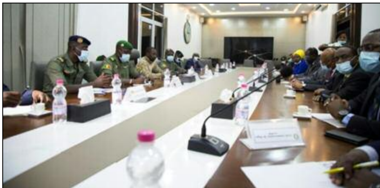
La junte qui a pris le pouvoir le 18 août au Mali et la délégation de la Cédéao à la table des négociations le 22 août 2020 à Bamako