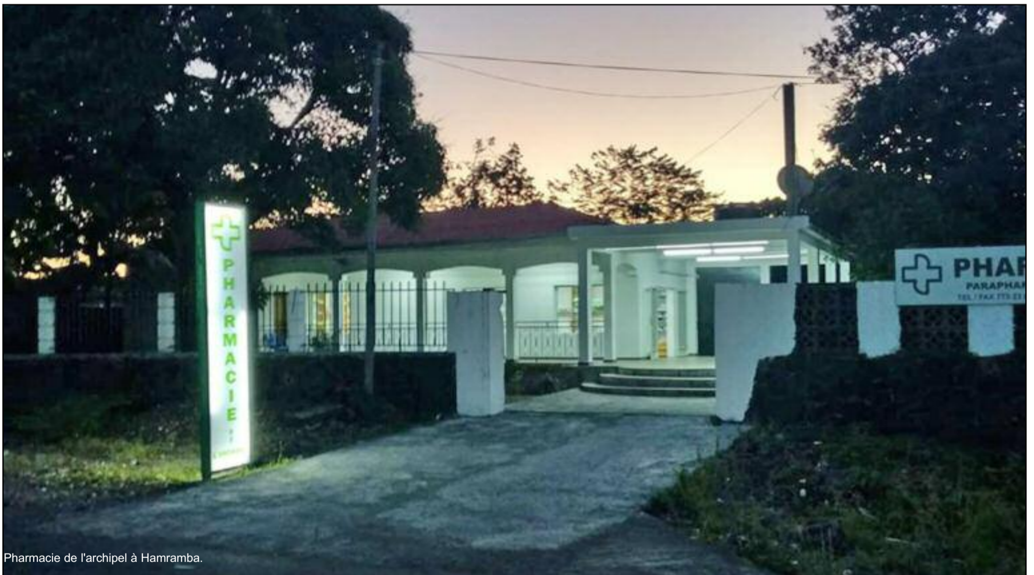
Pharmacie de l'archipel à Hamramba.