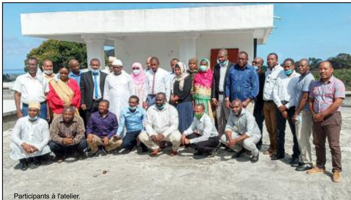
Participants à l'atelier.

D'après le Représentant de la FAO, les enfants malnutris ont un potentiel d'apprentissage scolaire limité et, par voie de conséquence, des possibilités d'emploi et de revenu réduites à l'avenir, ce qui perpétuera le cycle de la pauvreté. De plus les personnes qui souffrent de malnutrition ont des défenses immunitaires affaiblies, tombent malades plus facilement et plus souvent, et ont plus de difficultés à guérir rapidement et complètement. Pour prévenir les carences en micronutriments, les aliments peuvent être "enrichis" c'est-à-dire renforcés en