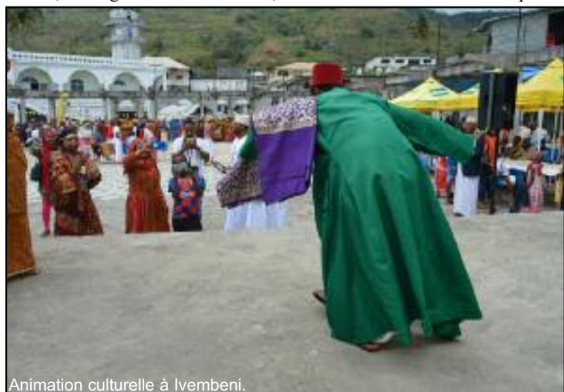
Animation culturelle à Ivembeni.