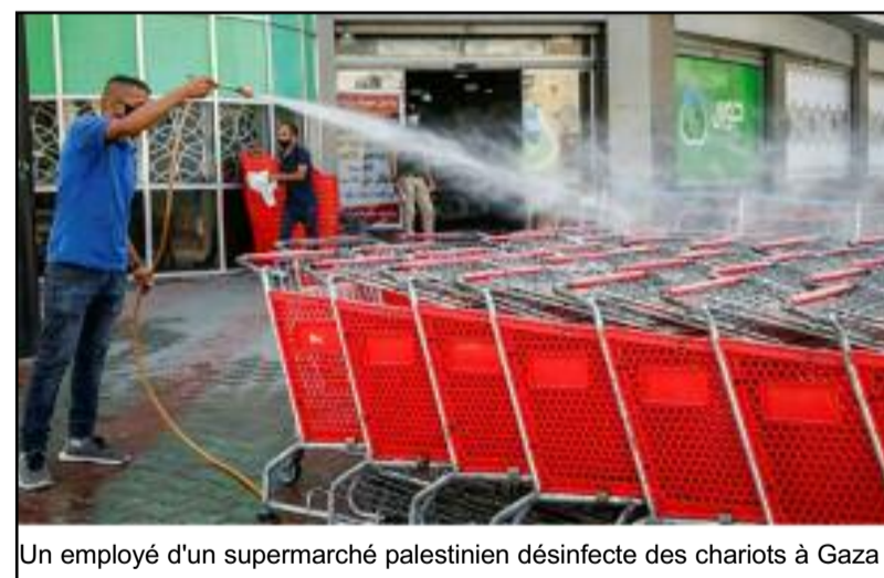
Un employé d'un supermarché palestinien désinfecte des chariots à Gaza |

Après six mois de fermeture, tous les pubs ont rouvert lundi en Irlande à l'exception de ceux