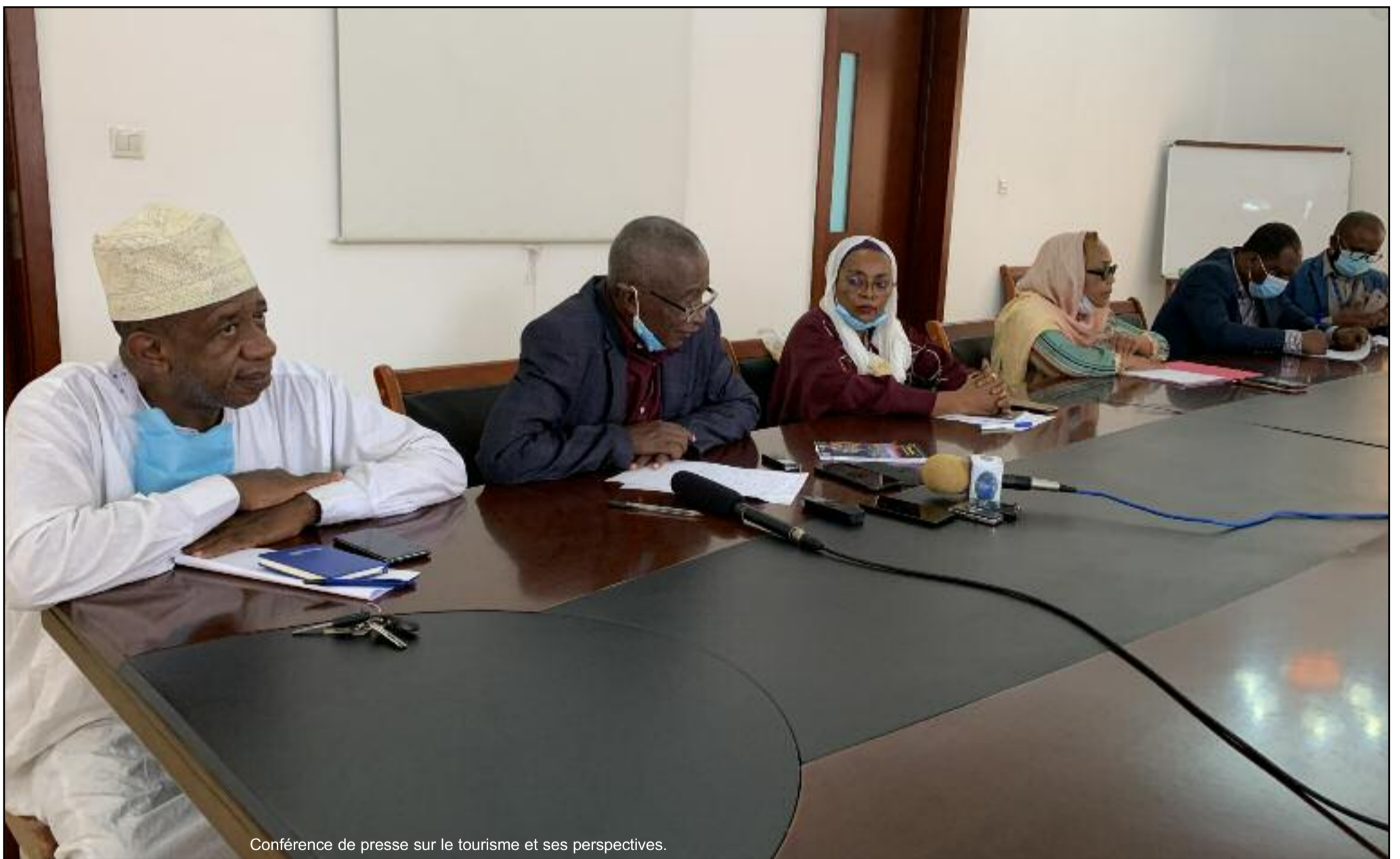
Conférence de presse sur le tourisme et ses perspectives.

SENSIBILISATION CONTRE LE VIOL SUR MINEUR