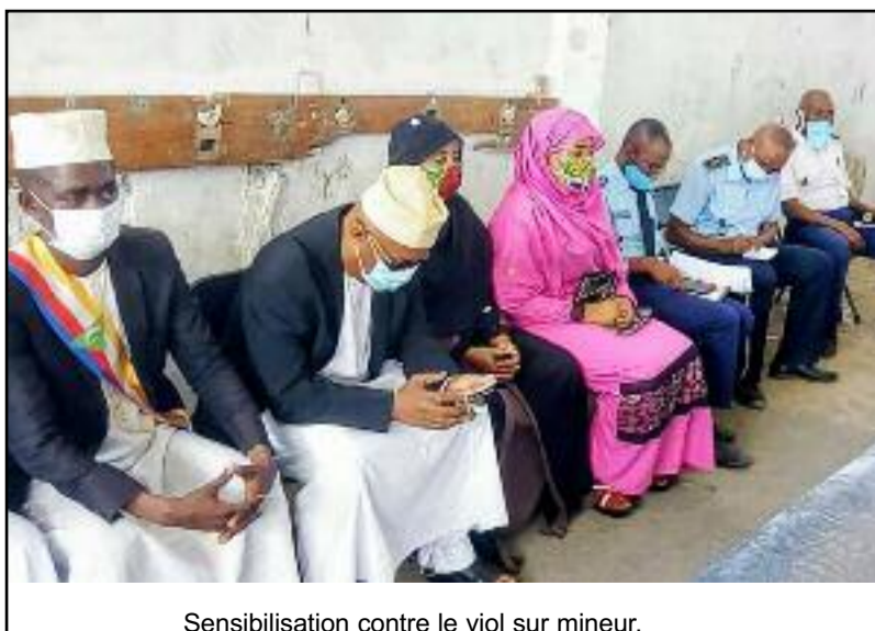
Sensibilisation contre le viol sur mineur.