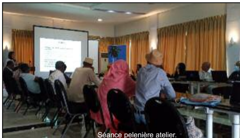
Séance pelenière atelier.