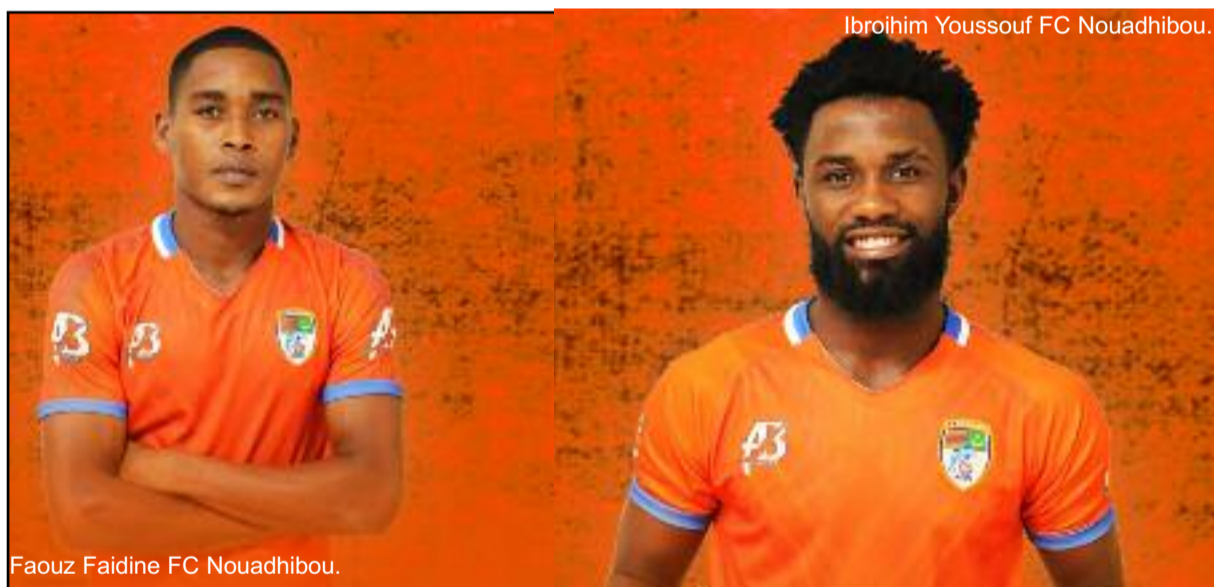
Faouz Faidine FC Nouadhibou.