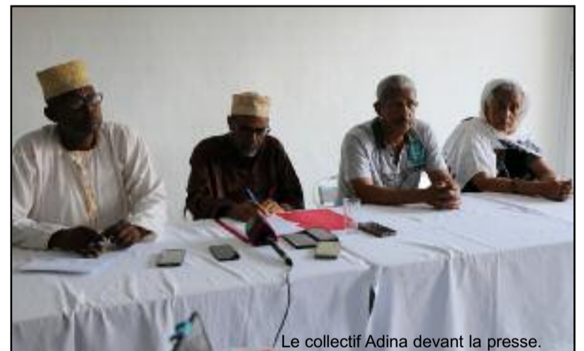
Le collectif Adina devant la presse.