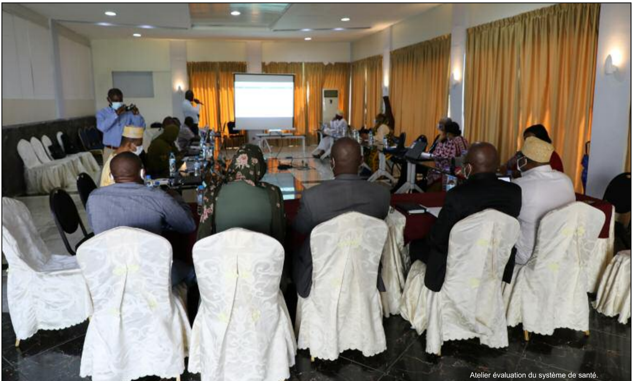
Atelier évaluation du système de santé.