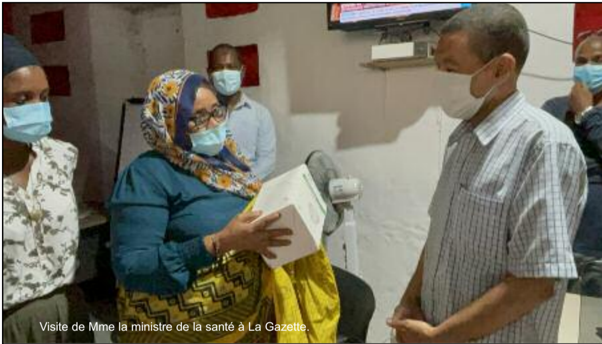
Visite de Mme la ministre de la santé à La Gazette.

La ministre de la santé et de la solidarité, Louba Yacouti Athoumane a fait un passage inattendu à La Gazette des Comores. C'était l'occasion pour la ministre de rencontrer le personnel de la boîte et leur offrir des cache-nez. La ministre a saisi l'occasion pour remercier les efforts fournis du journal en cette période de crise sanitaire. Et elle a souhaité une forte solidarité pour bien sensibiliser la population. « Cette visite symbolise ma solidarité avec les médias. Je tiens à remercier la presse comorienne notamment La Gazette des Comores. Vous faites un