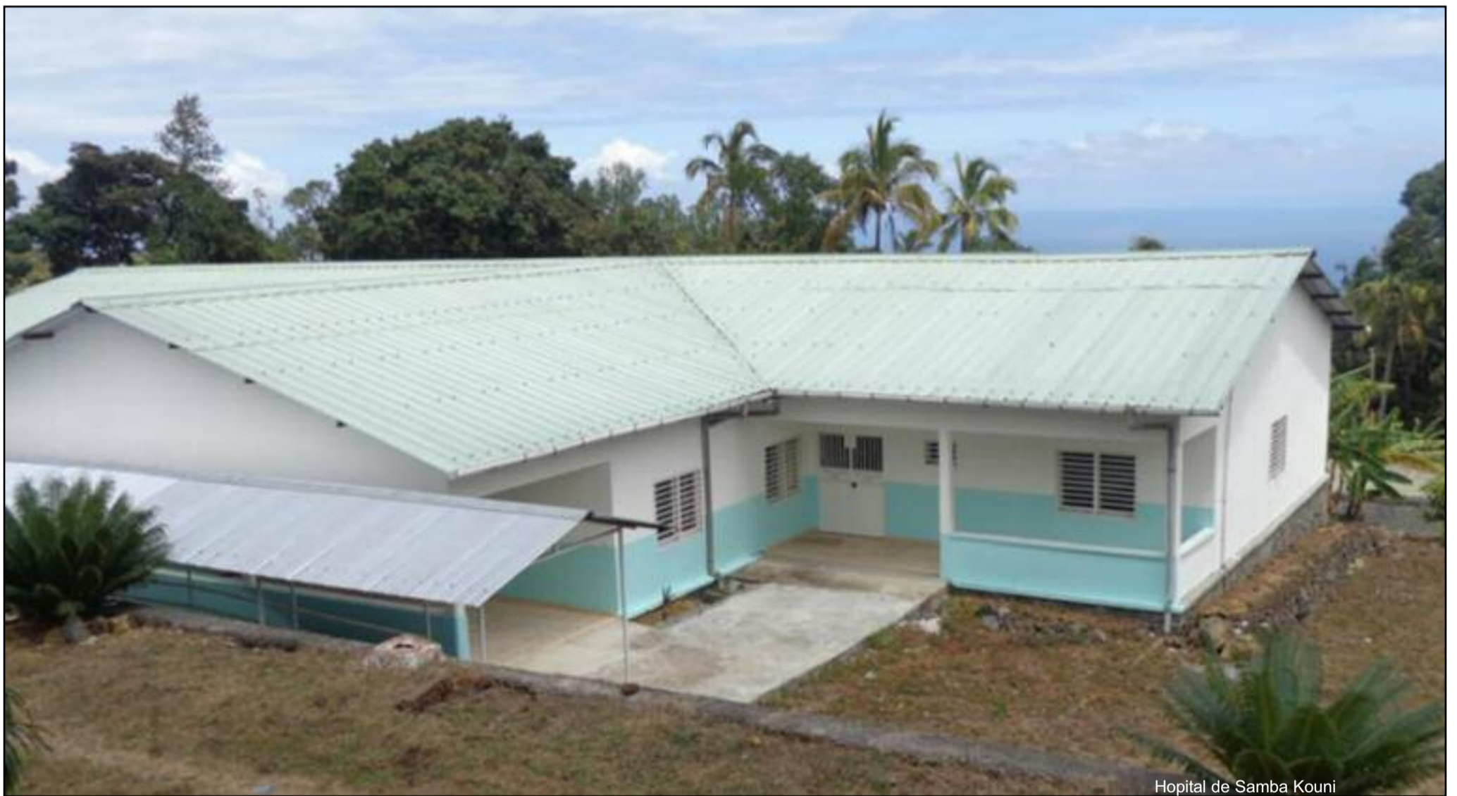
Hopital de Samba Kouni