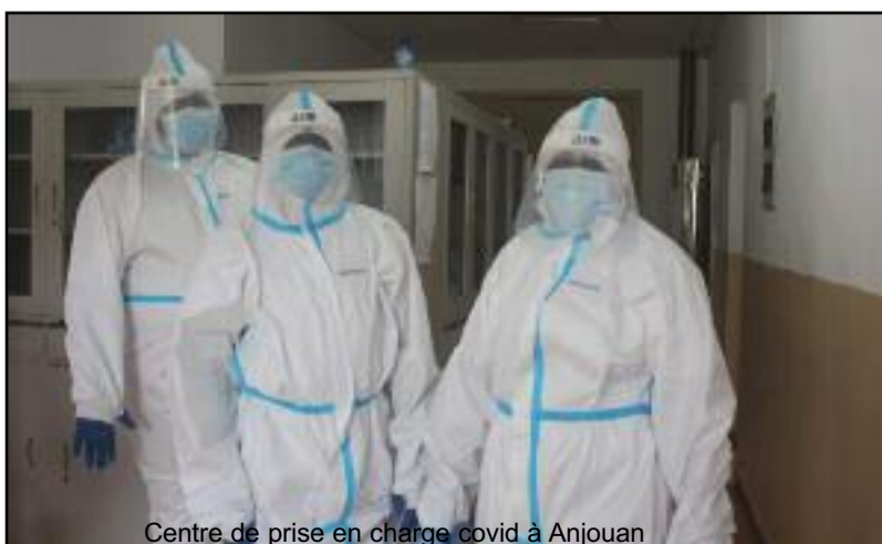
Centre de prise en charge covid à Anjouan

La deuxième vague du Coronavirus vient de faire trois morts à Anjouan, dans la journée du mercredi 13 janvier. Les acteurs impliqués appellent à la vigilance.