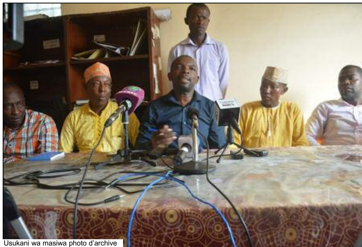
Usukani wa masiwa photo d'archive