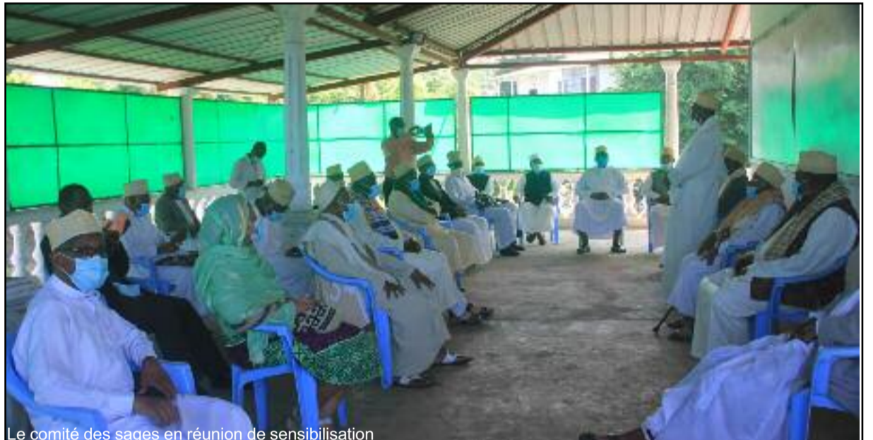
Le comité des sages en réunion de sensibilisation

Ce dernier montre que ce geste fait partie de nos traditions. Une fois qu'un village, région ou île est touchée, on lui vient toujours en aide, n'en parlons plus cette crise sanitaire. « Cette situation inédite, préoccupe tout le monde. Il faut lutter contre ce virus qui se propage rapidement. Il est de notre devoir de sensibiliser la population et de respecter les mesures préventives afin de stopper sa propagation », souligne-t-il.