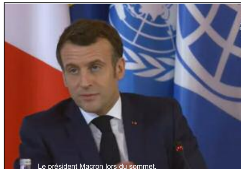
Le président Macron lors du sommet.

La promotion de l'agro-écologie permet de protéger la diversité des écosystèmes en réduisant les pollutions tout en permettant plus de création d'emplois et en agissant pour la sécurité alimentaire. Le sommet a mis l'accent sur l'accélération de la mise en œuvre de la