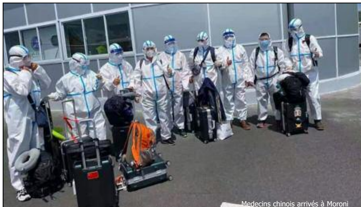
Medecins chinois arrivés à Moroni