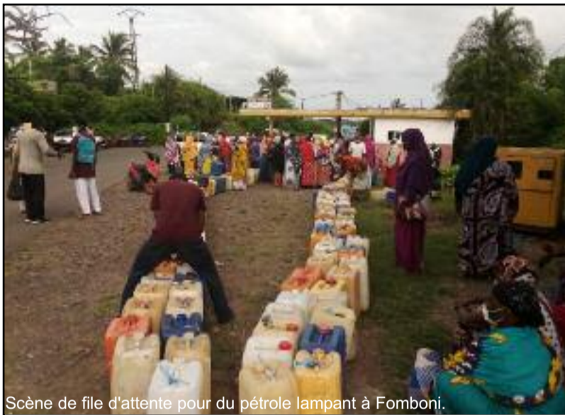
Scène de file d'attente pour du pétrole lampant à Fomboni.

Malgré l'explosion du nombre des cas positifs à Mohéli depuis le début de la deuxième vague à la mi-décembre, mais surtout le nombre de décès, certaines personnes ne croient toujours pas à la pandémie. Pour une dame que nous avons rencontrée dans une station-service, elle pense que « ce ne sont que des histoires inventées de toutes pièces ».