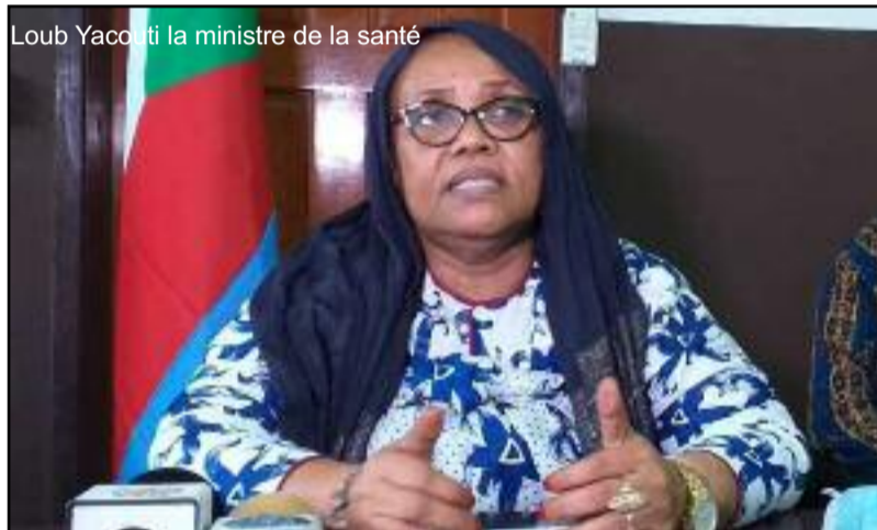
Loub Yakouti la ministre de la santé

En réaction à une information relayée par une agence de presse réunionnaise, faisant état d'« un cas mortel de fièvre hémorragique à virus Ebola aux Comores », la ministre de la Santé a tenu à rassurer que ce virus n'est pas présent aux Comores.