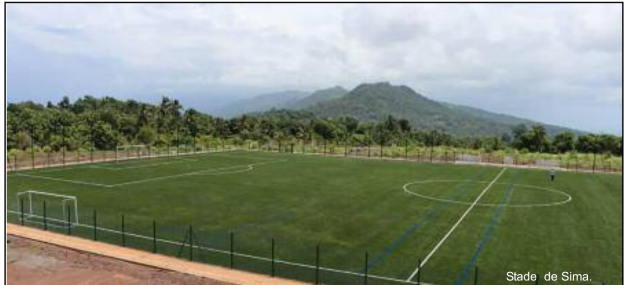
Stade de Sima.

La fin du chantier et la remise officielle des clefs nécessitent une durée approximativement de 3 ans (2018 à 2021). La 1ère phase