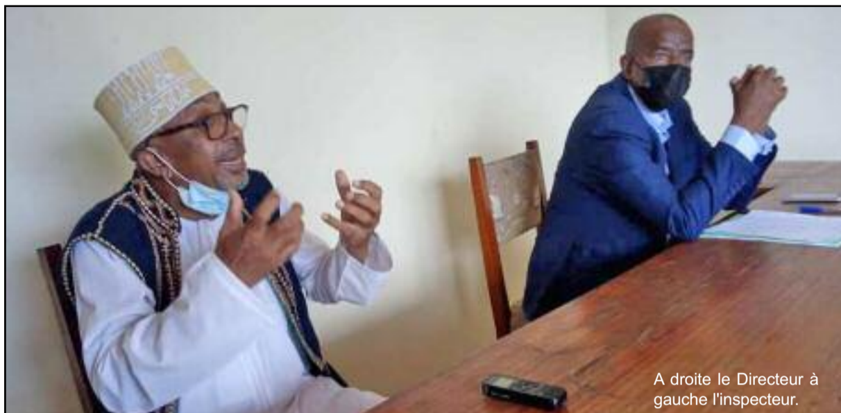
A droite le Directeur à gauche l'inspecteur.

Dans une conférence de presse, organisée à Moroni le mardi 9 février 2021, le directeur général de la jeunesse et des sports, et l'inspecteur général des Sports, ont tenu à clarifier la légitimité d'une association sportive, le rôle du comité olympique et la responsabilité du ministère de tutelle. Ces techniciens ont étayé leurs arguments sur les lois (1981 et 86/006), textes en vigueur aux Comores. Pour eux, officiellement, une association sans récépissé et agrément est considérée comme « illégale et fantôme ».