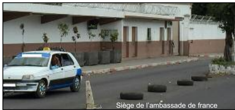
Siège de l'ambassade de France

Ayant soumis une demande aux fins d'obtention d'un passeport français avec les papiers obtenus auprès de l'avocat en question, la femme était surprise de recevoir de la part de l'ambassade de France aux Comores un courrier