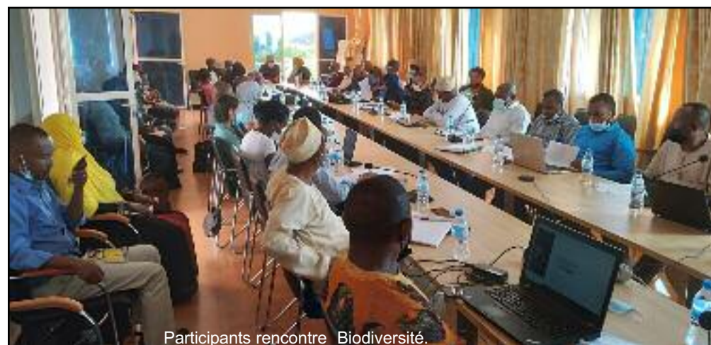
Participants rencontre Biodiversité.

Parmi les risques liés à la mise en œuvre du projet, il se pourrait que les communautés ne s'engagent pas à faire les efforts nécessaires pour assurer la durabilité de leurs prélèvements de ressources et qu'une instabilité institutionnelle entraîne une mobilité élevée des bénéficiaires des formations. Et aussi rencontrer des difficultés à mobiliser le personnel requis au sein des institutions ciblées en raison des contraintes d'embauche dans la fonction publique et du manque de motivation des divers comités. Des risques récurrents dans ce domaine.