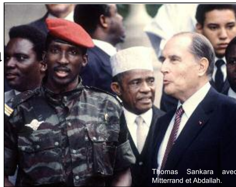
Thomas Sankara avec Mitterrand et Abdallah.

Dans la foulée, en mai 2015, en présence des membres de leurs familles et de leurs avocats, le gouvernement burkinabè procédait à