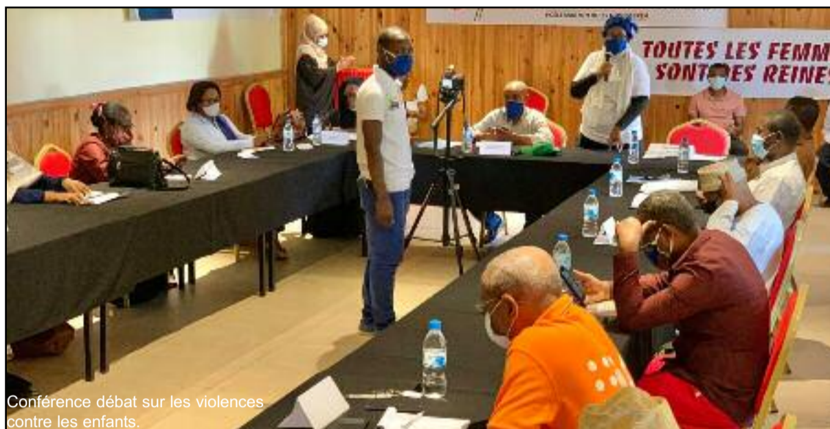
Conférence débat sur les violences contre les enfants.