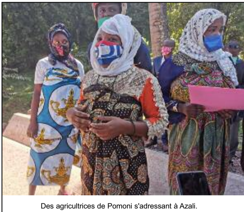
Des agricultrices de Pomoni s'adressant à Azali.

« Le projet a commencé avec des familles vulnérables qui vou-