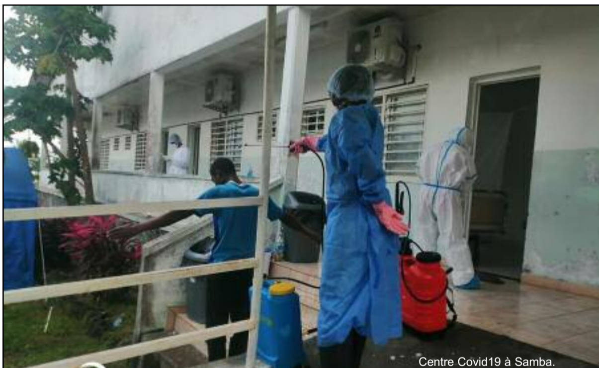
Centre Covid19 à Samba.