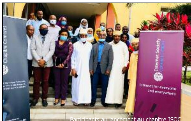
Participants au lancement du chapitre ISOC