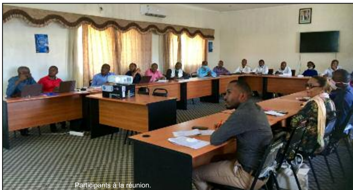
Participants à la réunion.

Pour rappel, le PIDC est une initiative du Gouvernement Comorien, financé par la Banque Mondiale et visant à réduire la pauvreté en soutenant la croissance économique dans notre pays. Ce projet a pour but de relever les défis de la transformation structurelle de l'économie comorienne en mettant l'accent sur le développement des chaînes de valeur dans les secteurs agricoles/agroalimentaires, touristiques et secteurs associés et la mise