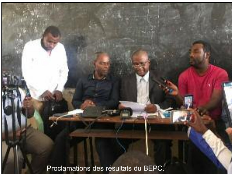
Proclamations des résultats du BEPC.

Les résultats Bepc 2020 à Ngazidja ont été proclamés jeudi 10 septembre. 36,85%, tel est le taux de réussite au 1er groupe, contre 26,89% au 2e groupe. Les fraudes ne sont pas en reste puisqu'elles représentent un taux de 1,78%.